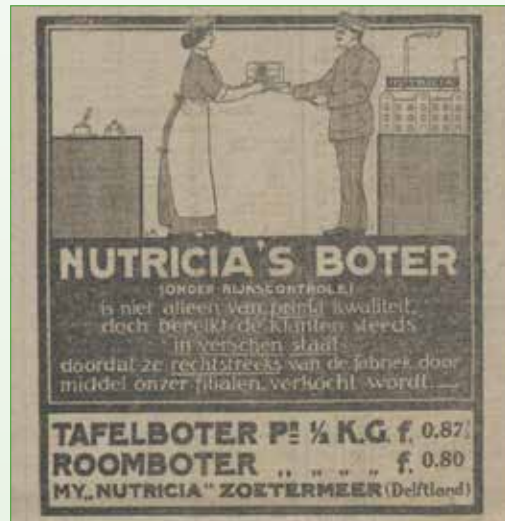
De Tijd 9-8-1915

De roomboter- en kaasfabriek heeft niet lang bestaan. In maart 1885 wilden Enthoven en Van Aardenne de fabriek blijkbaar al van de hand doen door een openbare vrijwillige verkoping van de "in werking zijnde roomboter- en kaas-