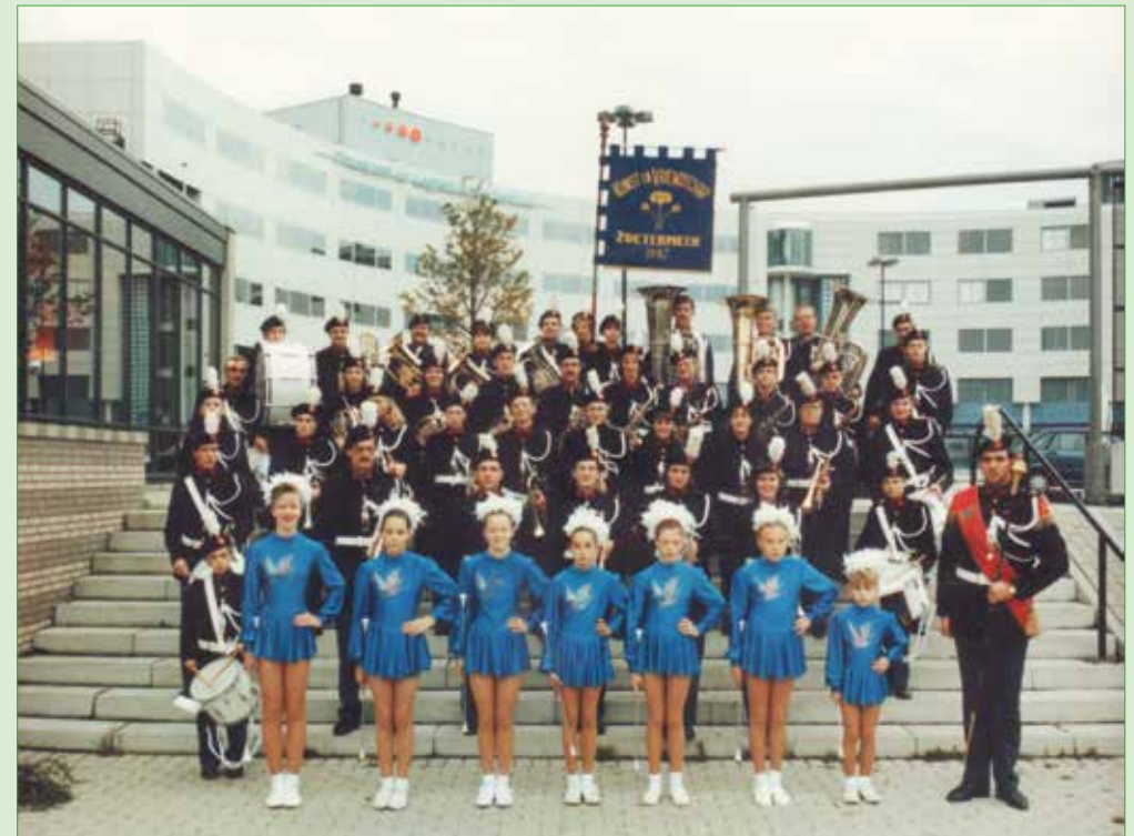
Kunst en Vriendschap, band met majorettes, 1993