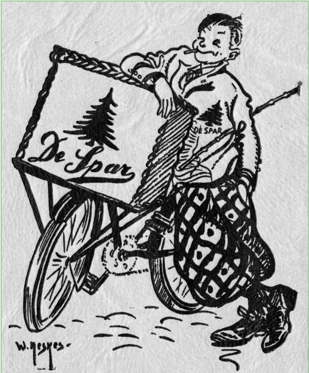
Pé, de jongen die bij De Spar symbool stond voor de thuisbezorging van de bestelde goederen