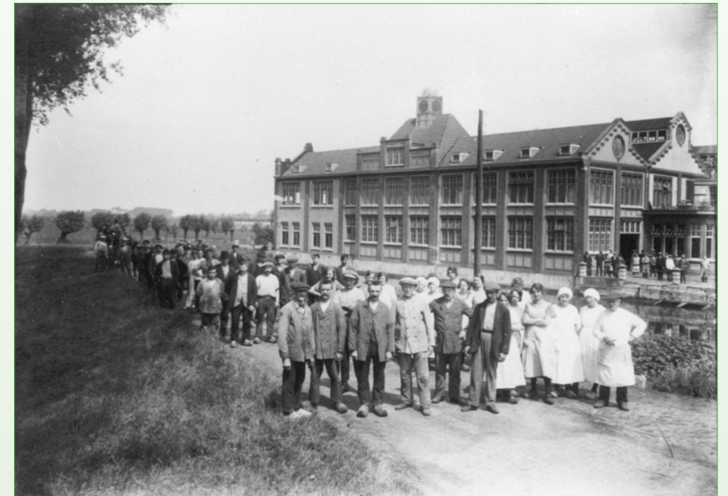
Vanaf 1880 was er een nieuw soort werknemer in Zoetermeer en Zegwaard, de 'fabrieksarbeider'; hier het personeel van Nutricia omstreeks 1920

gestopt met produceren is niet bekend. Mogelijk werd de onderneming de dupe van de 'strijd' tussen de dure roomboter en de goedkope 'kunstboter' (margarine). Door het gesjoemel met de goedkopere margarine hadden 'echte' roomboterproducenten het lastig. De strijd werd in 1889 beslecht met de Boterwet waardoor margarine voortaan geen boter meer mocht heten. Maar dit was voor de Zoetermeerse fabriek te laat. Blijkbaar gebeurde er tussen november 1885 en februari 1887 niets meer op de fabriek. De productie was stilgelegd en pas in 1887 werd de fabriek opnieuw openbaar verkocht. Dit was inclusief de stoommachine van Backer en Rueb van 6 paardenkracht en ook twee centrifuges van het type Petersen maar ook "een zwarte bles (ruin), 3 koeien, 17 varkens, coupé, tilbury, varkenswagen, kroswagen