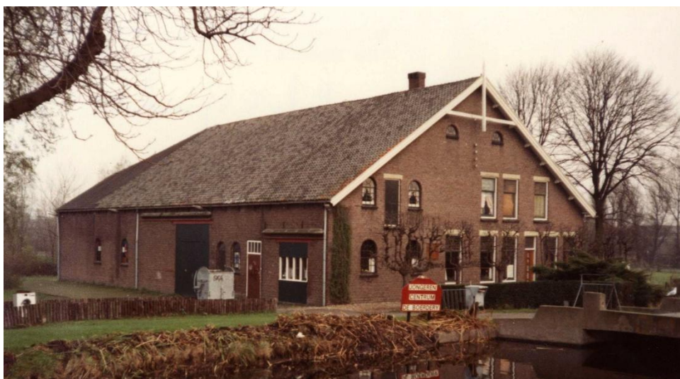
Jongeren centrum De Boerderij, rond 1995 nog aan de Voorweg 146

In 2025 vierde Poppodium Boerderij haar 50-jarig bestaan, met als hoogtepunt de documentaire Van Kraakpand tot Internationaal Poppodium van documentairemaker Marc Waltman. De film bracht vrijwilligers, medewerkers en bezoekers samen en