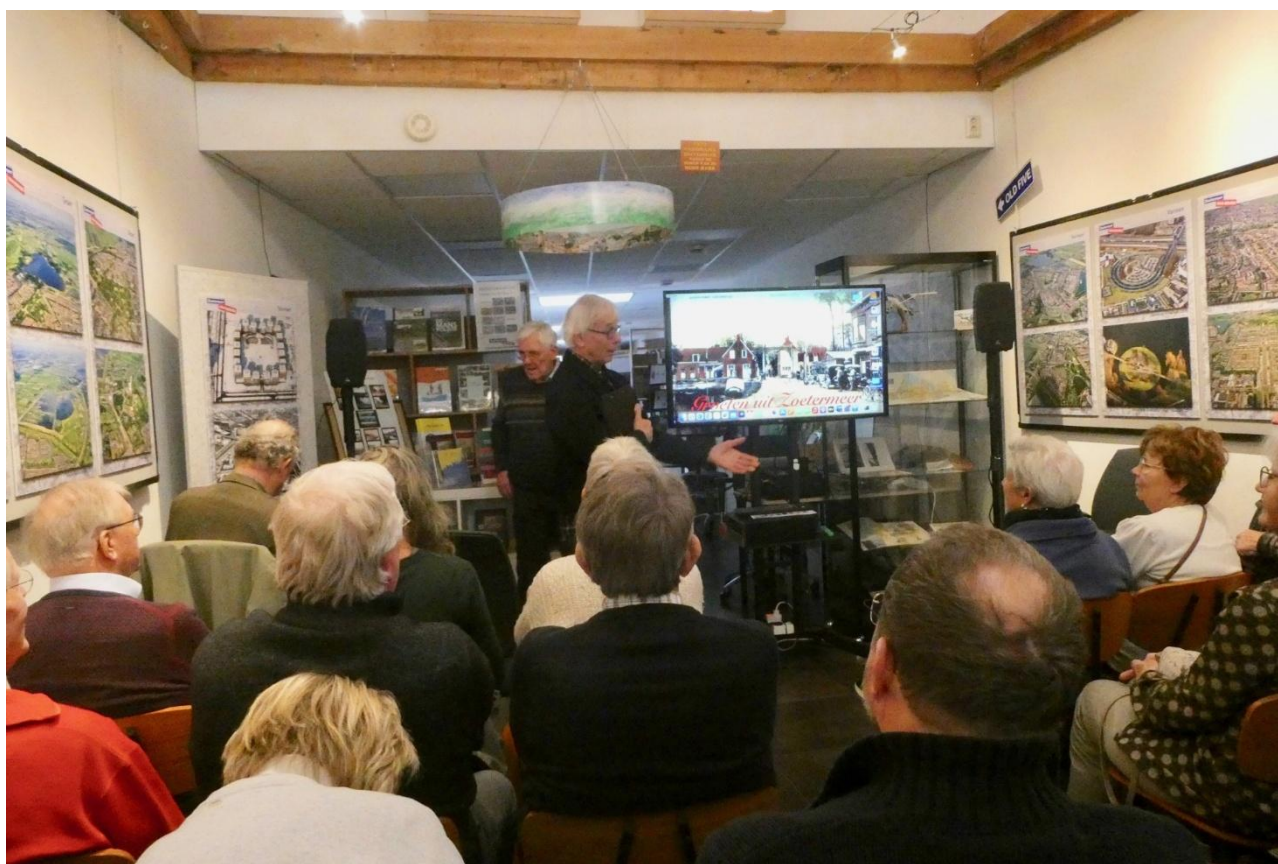
Een van de volgeboekte Filmmiddagen in Dorpsstraat 132

Het aanwijzen van monumenten is stopgezet en er komt een onafhankelijke evaluatie. Ook zal de gemeenteraad voortaan gaan over het aanwijzen van monumenten, wat positief is (grotere openbaarheid). HGOS hoopt dat na de verkiezingen een herstart kan worden gemaakt".