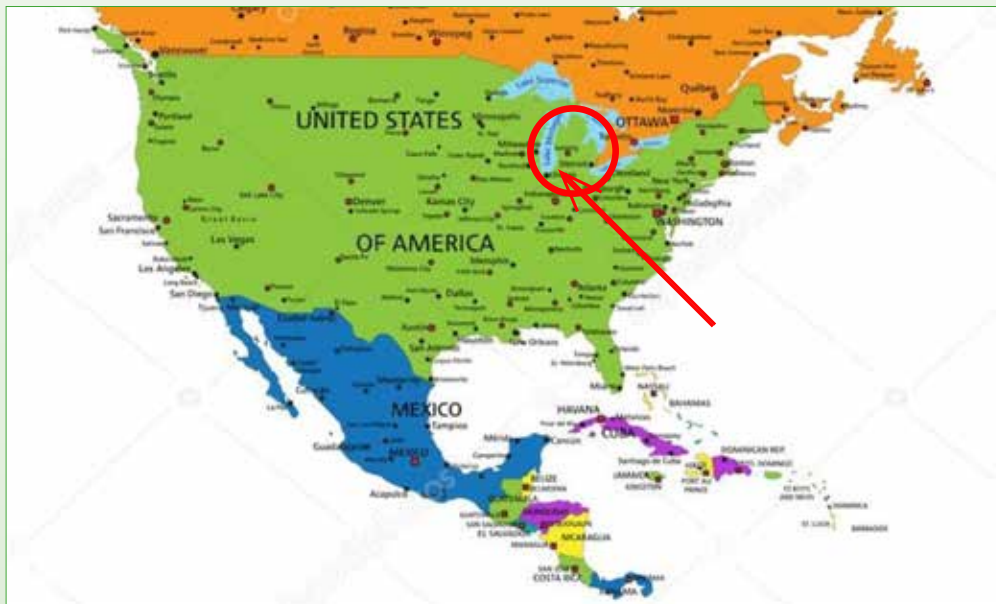
Ligging van Zeeland bij Holland in Michigan

Pieter Huijser: "Wij zijn toen nog dienzelfden dag afgevaren en werden den volgenden morgen om 9 uur aan den mond van de Kalamazoo rivier afgezet. Wij brachten onze bagage over op een platboot, die in de Kolonie thuis behoorde; en toen begon de grap. Vier onbedreven schippers, waarvan twee aan een lange lijn trokken en twee aan het roer stonden. Telkens zaten wij vast op het zand en dan moesten wij over boord springen en tot het middel in het water staande, de boot oplichten en over de zandbank duwen."