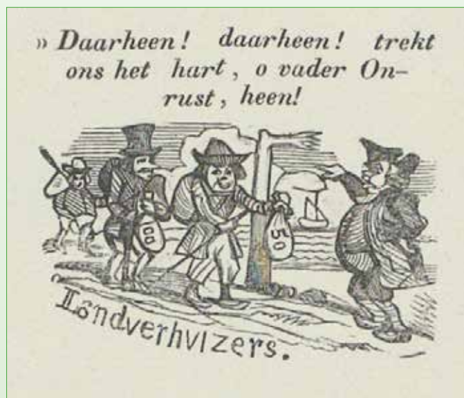
Fragment uit een spotprent op het vertrek van Nederlandse gereformeerden naar Amerika, 1847