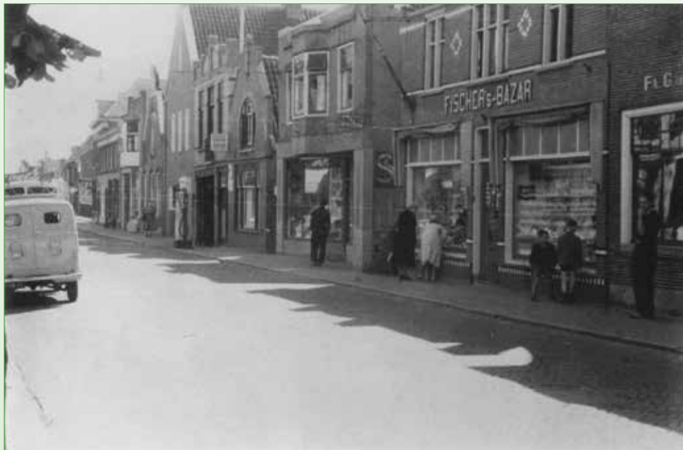
Fischer's Bazar aan de Dorpsstraat 75, 1952