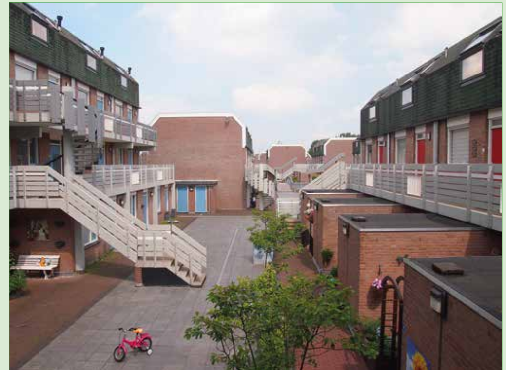
Zicht op een van de woondekken in Buytenwegh

Wij willen u graag ook via email op de hoogte houden van interessant nieuws betreffende Oud Soetermeer. Indien u dit wilt kunt u uw email-adres doorgeven (indien nog niet eerder gedaan) aan Ledenadministratie@oudsoetermeer.nl . Graag met vermelding van uw naam en adres.