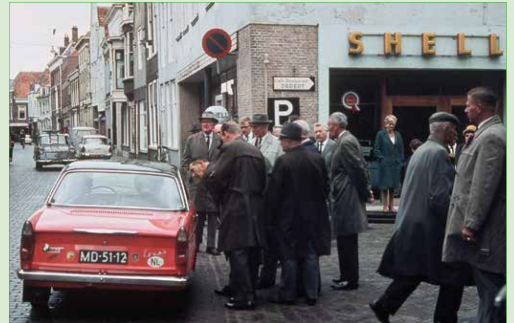
Mannen met hoeden in Brielle, één van de eerste excursies van Oud Soetermeer in 1965