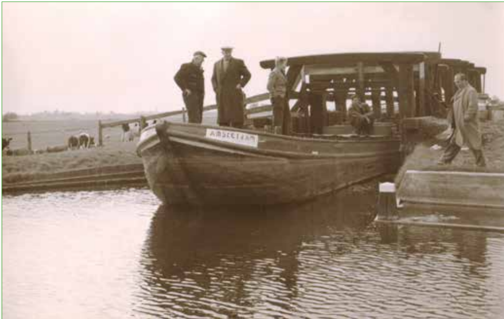
De 'Amsterdam' vaart in 1957 voor de laatste keer door de sluis van Spijker bij de Slootweg

terpolitie, die lette streng op dat je de goede verlichting voerde. Dat moest ook wel voor de veiligheid, ze kwamen ook soms aan boord voor drankinspecties. Dat was bij ons nooit aan de orde.