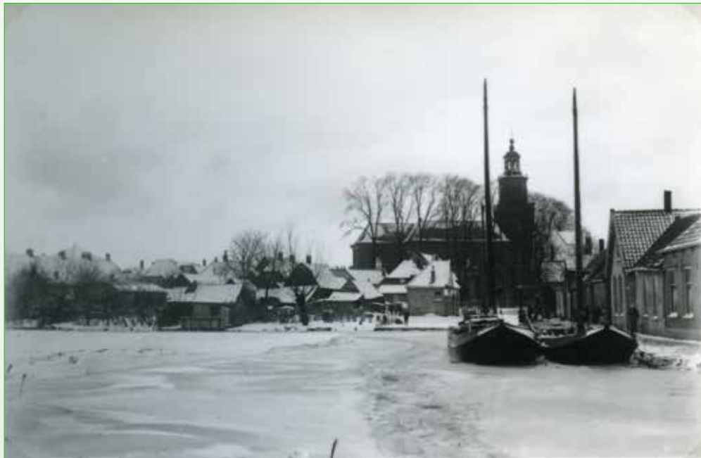
Binnenschepen in de haven aan de Leidsewallen in de jaren 19(20)