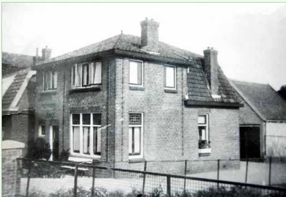
Stationsstraat 68 rond 1940