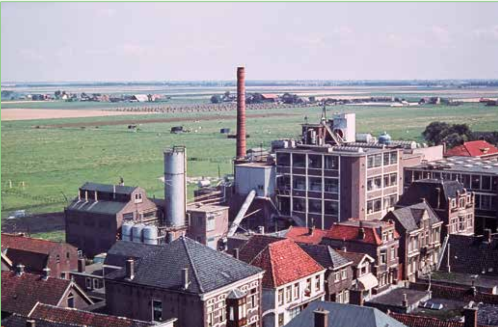
De gebouwen van Brinkers Margarinefabrieken toeren hoog boven de Dorpsstraat uit rond 1965

Anneke raakt al aardig thuis in het dorp, alleen aan de geur van het boerenland en van de Brinkersfabriek in de Dorpsstraat is zij nog niet gewend. In een volgende aflevering van 't Seghen Waert neemt zij u onder andere mee naar het carnaval, tandarts Kentgens, het vierde lustrum van de bevrijding en het bezoek van koningin Juliana aan Zoetermeer.