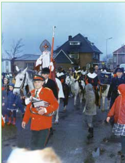
Intocht van Sinterklaas in Zoetermeer in de Dorpsstraat, 1965