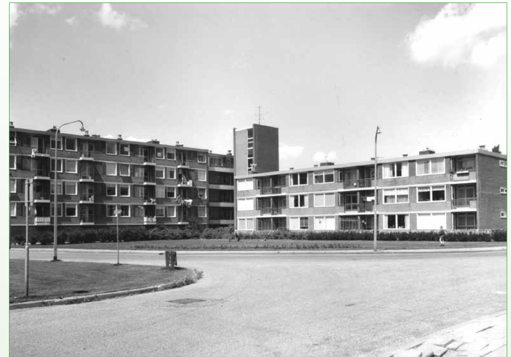
Van Brakelstraat gezien vanaf de Karel Doormanlaan, begin jaren (19)60