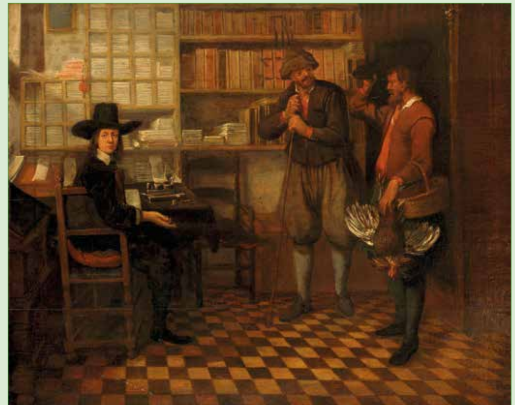
Pachtbetaling door boeren, deels in natura; schilderij door Q.G. v. Brekelenkam rond 1665 (Coll. Rijksmuseum SK-A-2698)

De Driemanspolder is verkrijgbaar bij Historisch Genootschap Oud Soetermeer ( www.oudsoetermeer.nl onder publicaties) voor € 23 plus verzendkosten. In te zien en ook te kopen aan de Dorpsstraat 132 op maandagavond, woensdag- en zaterdagmiddag. Leden hoeven slechts € 18 te betalen!