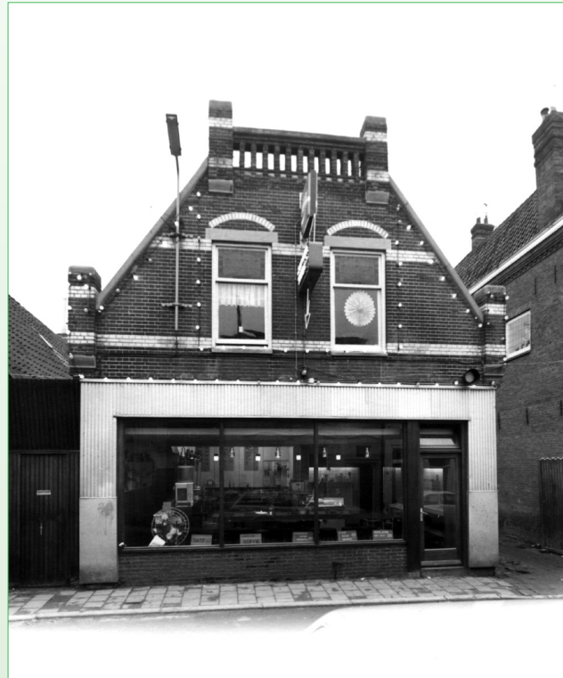
Snackbar Van Schooten aan de Dorpsstraat 41 in 1972