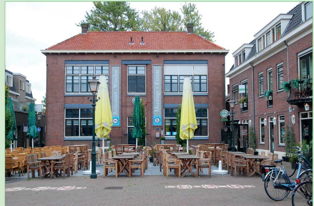
Voormalige openbare lagere school aan de Dorpsstraat 114 in 2009

De Nicolaaskerk, Oude kerk, Adventskerk, Pelgrimskerk en Vredekerk zijn geopend en bieden een interessant programma. Speelboerderij het Buitenbeest, gevestigd in een monumentale boerderij, heeft zondag een speciaal programma voor kinderen. Van molen De Hoop is alleen de winkel en het molenplein geopend. De bovenverdieping is in verband met corona gesloten. Ardito Fotografie heeft daarvan een scan gemaakt zodat deze via een link op de website toch virtueel is te bezoeken. De historische tuinen Hof van Seghwaart en Zoete Aarde geven informatie en er zijn openluchtactiviteiten die vooral voor kinderen leuk zijn. Ook de Watertoren in Rokkeveen en de Tangogarage in Palenstein zijn geopend. De harmonie Kunst & Vriendschap speelt op het plein in de Dorpsstraat. Scholen komen vooral aan bod wanneer u een wandeling maakt door de Dorpsstraat en zich via het programmaboekje of website laat informeren. Halverwege kunt u in het gebouw van Oud Soetermeer de tentoonstelling 'Leren in Zoetermeer' bezoeken met foto's en film. Eindpunt van de wandeling is de voormalige school Kleutervreugd, nu in gebruik bij de stichting Welzijn Zorg Doven. Hier kunt u een workshop gebarentaal volgen speciaal voor horenden.