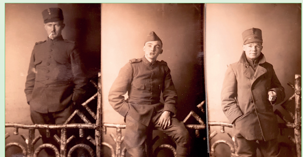
Drie militairen uit het 3e Regiment Wielrijders, ingekwartierd in Bleiswijk. Hun foto is naar Zoetermeer en Zegwaart gestuurd