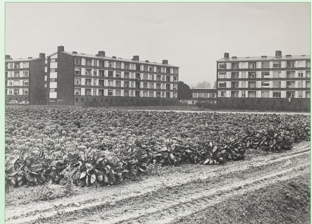
Flats aan het einde van de Karel Doormanlaan rond 1970