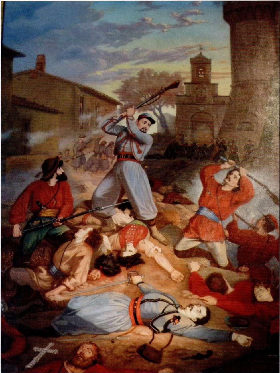
Schilderij van de slag bij Mentana met de held Pieter Janszoon Jong (Coll. Zouavenmuseum Oudenbosch)