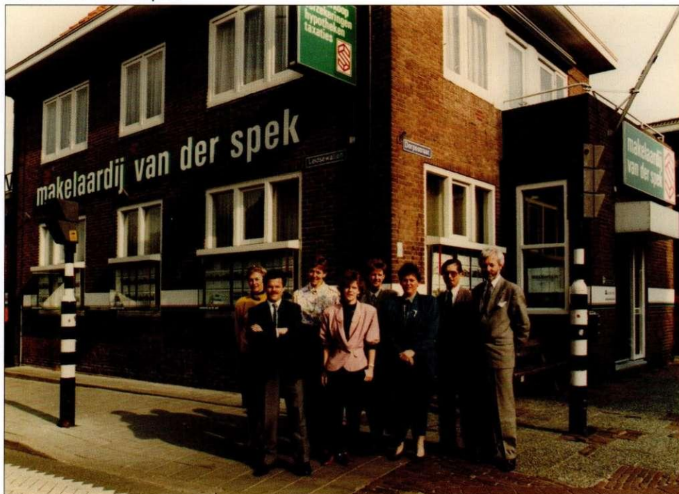
Medewerkers van de makelaardij bij het kantoor Dorpsstraat 50, jaren (19)80