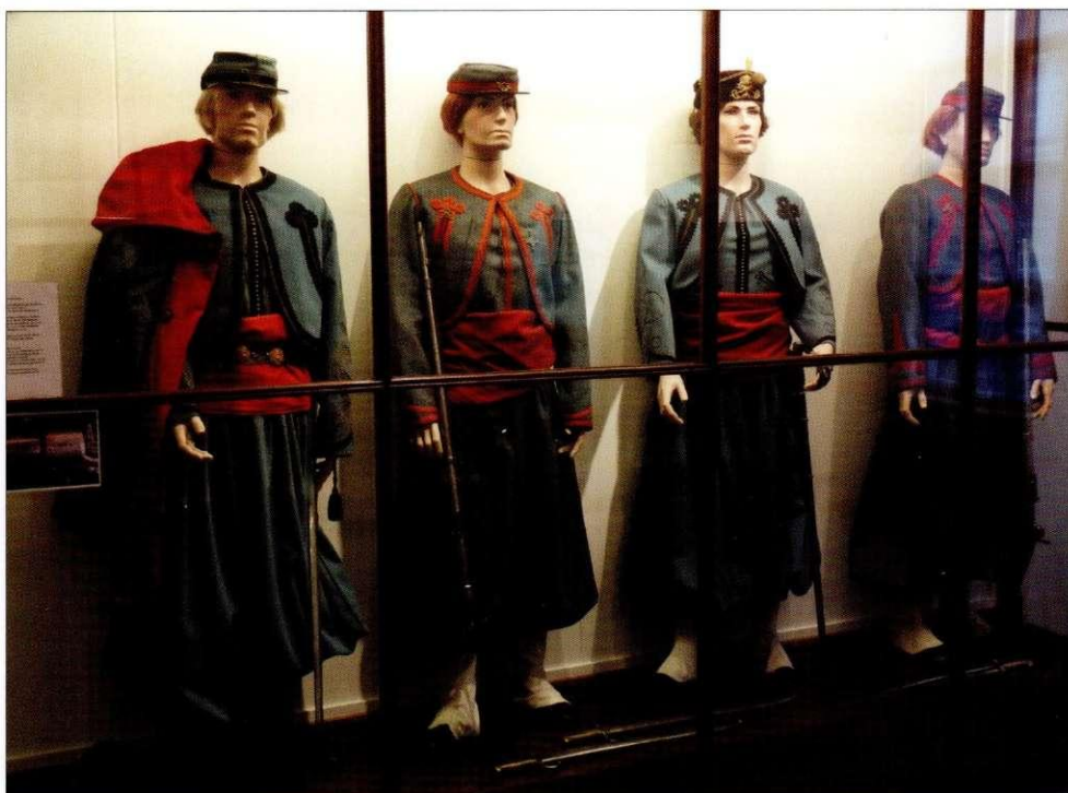
Uniformen waarin de zouaven in de 19 e eeuw ten strijde trokken, aanwezig in het Zouavenmuseum in Oudenbosch