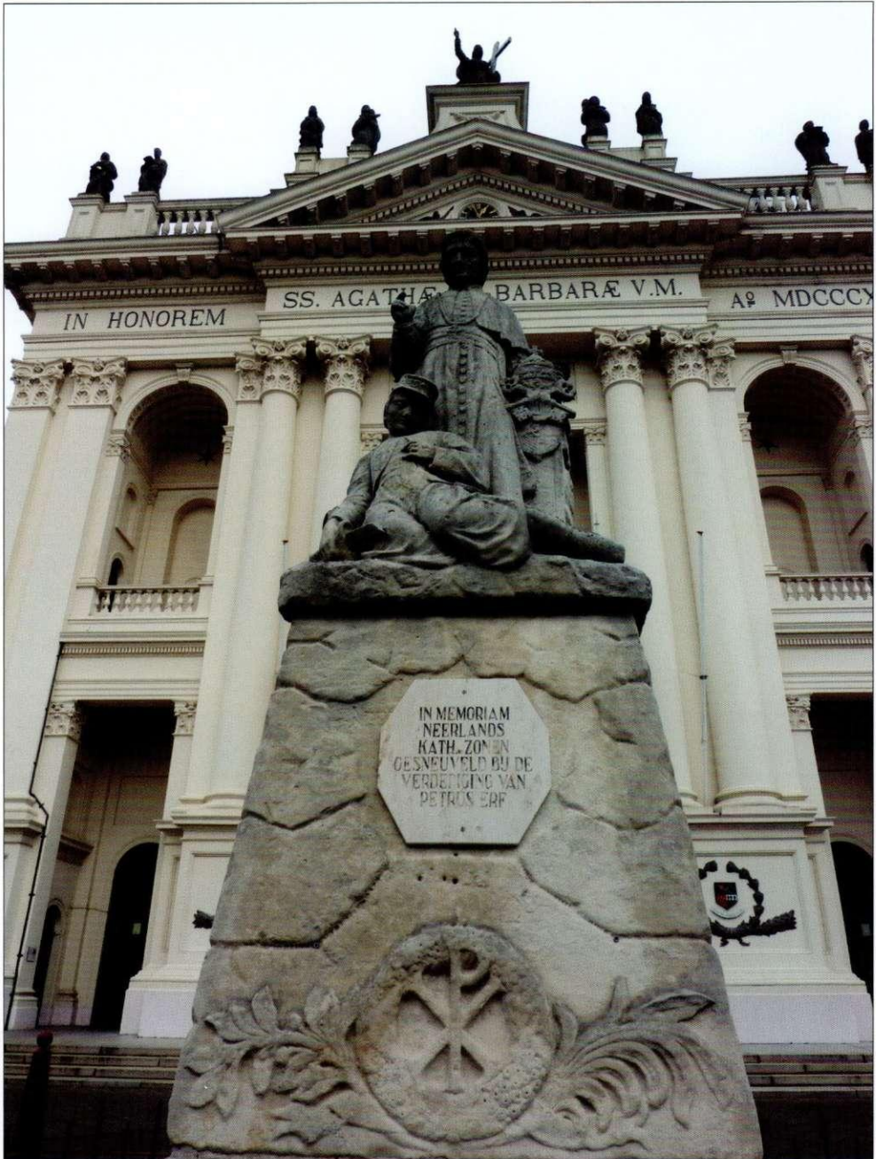
Monument voor de mannen "gesneuveld bij de verdediging van Petrus erf" bij de Basiliek in Oudenbosch