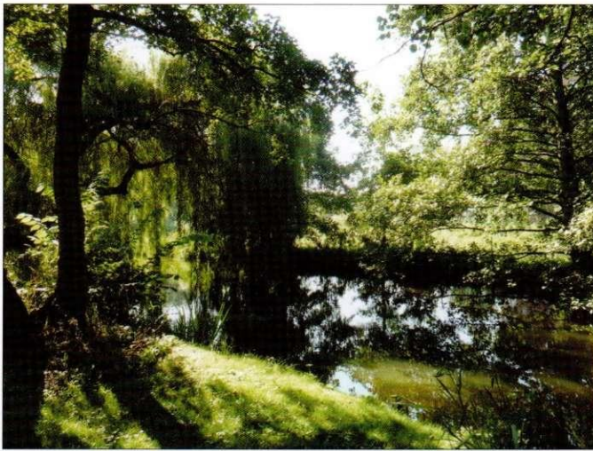
Het mooiste plekje van Zoetermeer, achter 't Oude Huis

De jaren die volgden waren vooral gewijd aan Oud Soetermeer. We zaten in de lift, van 300 naar 1300 leden, met name door 't Oude Huis, ons steeds fraaiere en professionelere 't Seghen Waert, vele boeken en nog meer activiteiten. Na enkele jaren ging de organisatievorm waarbij de vereniging het bestuur van de stichting benoemde, echter knellen. De stichting Museum 't Oude Huis wilde een andere koers varen en zich niet meer alleen op de historie richten. Na een emotionele ledenvergadering in mei 1998 was de splitsing een feit. Dat waren heftige maanden, waarin ik (Ton) bijna het vertrouwen in de mens verloor, maar uiteindelijk is alles goed gekomen.