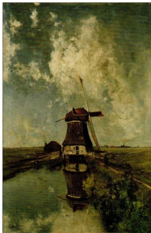
Dit schilderij van J.C. Gabriël uit 1889 geeft een prachtig beeld van het Hollandse landschap met een watermolen. Hij woonde destijds in Scheveningen en schilderde vaak in de nabije omgeving (Coll. Rijksmuseum SK-A-1505)