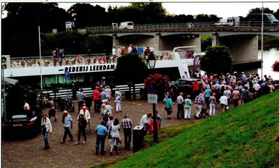
Verzamelen bij de rondvaartboot

Even over de klok van twee uur nam de rondvaartboot ons mee voor een vaartocht van anderhalf uur over de Linge met zijn prachtige huizen en landerijen. Weer terug bij het restaurant liepen we naar de bus, die ons snel en veilig terugbracht in Zoetermeer. Bij het uitstappen kreeg de activiteitencommissie de complimentjes voor de gezellige en geslaagde dag.