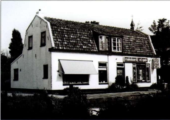
Makelaardij Van der Spek aan de Delftsewallen 17 in de jaren (19)70