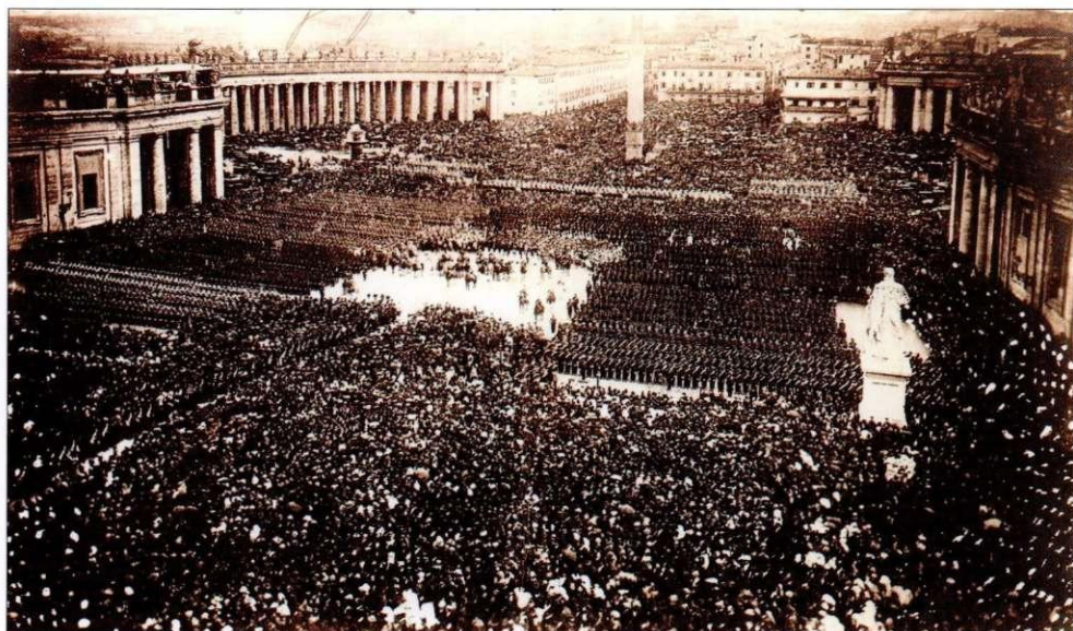
Zouaven op het plein voor de Sint Pieter in Rome 28 april 1870