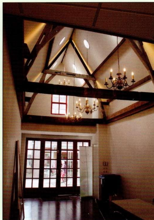
De ontvangstruimte in ons nieuwe pand

Wilt u zich aanmelden als lid, dan kan dit via de website: www.oudsoetermeer.nl