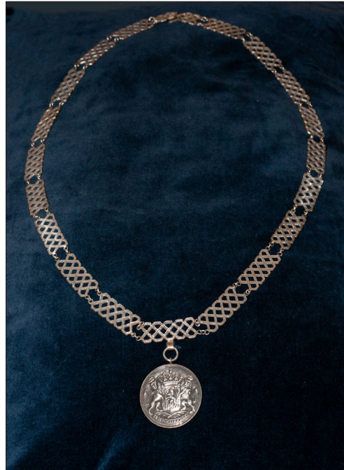
Ambtsketen van Zegwaart, 19e eeuw.

Deze regeling was natuurlijk niet zo maar tot stand gekomen. Minister van Binnenlandse Zaken was destijds R. Thorbecke en hij polste de provinciebesturen over de uitvoering. Ook was advies van de Raad van State nodig. De meeste provincies gaven de voorkeur aan een penning boven de ook voorgestelde sjerp: “de penning is eenvoudiger en achtbaarder dan de sjerp” . Thorbecke voegde daaraan toe: “dat de penning van zilver zij en aan een keten van hetzelfde metaal gedragen werd, gelijk vroeger hier te lande plagt te geschieden, zou mijns inziens met de waardigheid van het ambt van burgemeester strooken.”