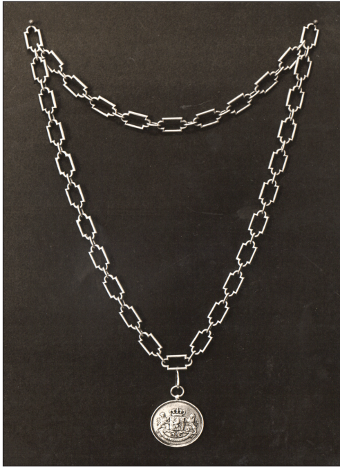
De ambtsketen van Zoetermeer uit 1853.