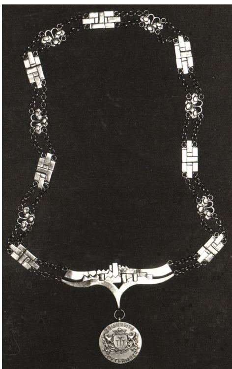
De sinds 1980 in gebruik zijnde ambtsketen van Zoetermeer.