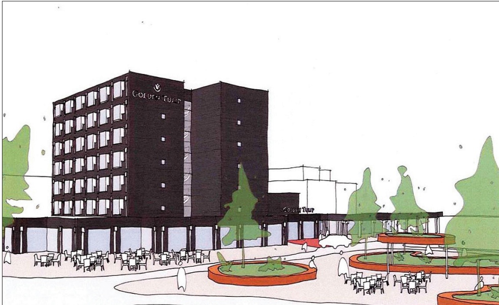
Impressie van de nieuwe gevels van het hotel en van de herinrichting van het plein . (Architectenbureau Piet Onderwater & Partners, 2013)