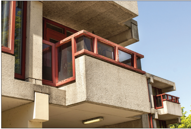
Het fraaie lijnenspel van de balkons en de ramen in een vaste ritmiek is kenmerkend voor het structuralisme.

hoognodig worden gemoderniseerd. De vernieuwing van het Golden Tulip wordt uitgevoerd door architectenbureau Piet Onderwater. Het eerste plan van het architectenbureau bleek weinig rekening te houden met de architectonische kwaliteiten van het gebouw. Van het lijnenspel van het structuralisme viel weinig meer te bespeuren in het nieuwe ontwerp, dat strak belijnde gevels toonde waar felle kleurenbanen overheen