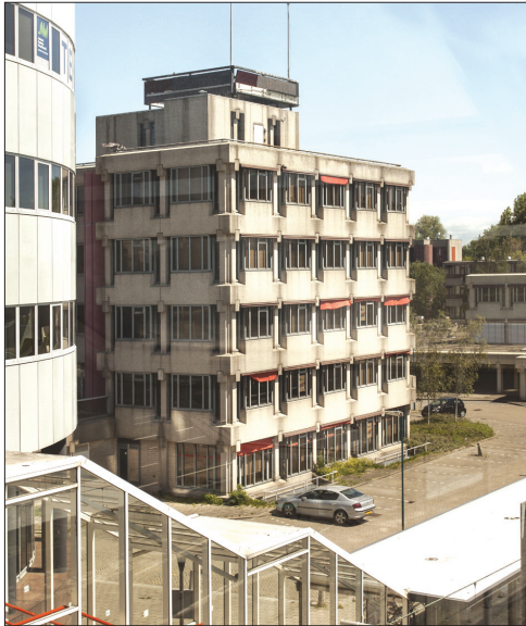
Het voormalige kantoor van Hopman wacht al jaren op een nieuwe functie.

lang het domicilie van makelaar en projectontwikkelaar Hopman maar het staat nu al een hele tijd leeg. Het grootste gebouw was bedoeld voor het hotel, in combinatie met kantoorruimtes en appartementen. Naast het hotel staat als derde object een appartementenblokje dat aan het wijkpark Driemanspolder grenst.