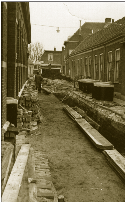
Aanleg van riolering in de Stationsstraat tussen de Pilatusdam en de Dorpsstraat.

een boot, later naar de Keulseweg in Pijnacker waar er een plas mee werd gedempt en ten slotte naar een stuk grond van de Erven Weduwe L. Brinkers-Blonk aan het einde van de Broekweg. In 1954 schafte de gemeente 1100 vuilnisemmers aan bij een plaatwerkerij voor 6 gulden 75 per stuk. Anno 2014 zijn er bijna 54.000 woningen en bij 32.000 daarvan staan twee mini-containers voor het verzamelen van afval.