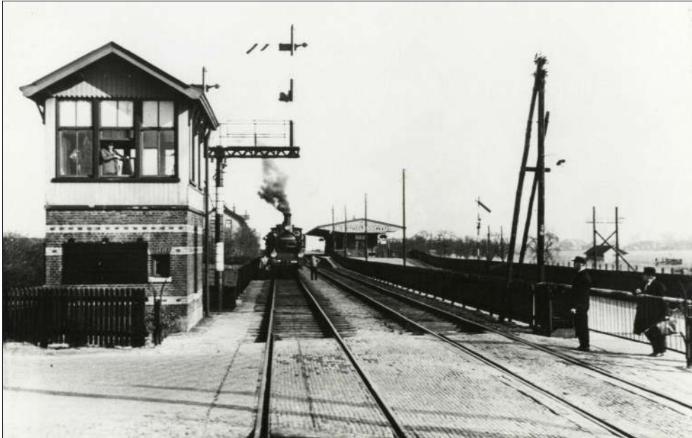
Het seinwachtershuisje naast de spoorwegovergang bij Station Zoetermeer-Zegwaard rond 1930

De regering deelde zijn visie en koos voor de spoorlijn langs de Oude Rijn. De Tweede Kamer verwierp echter de voorgestelde onteigeningswet. De NRS begon hierna met nieuwe onderhandelingen en verkreeg in 1867 de concessie. De spoorlijn Woerden-Leiden werd ruim acht jaar later in gebruik genomen, maar is tot op heden enkelsporig gebleven.