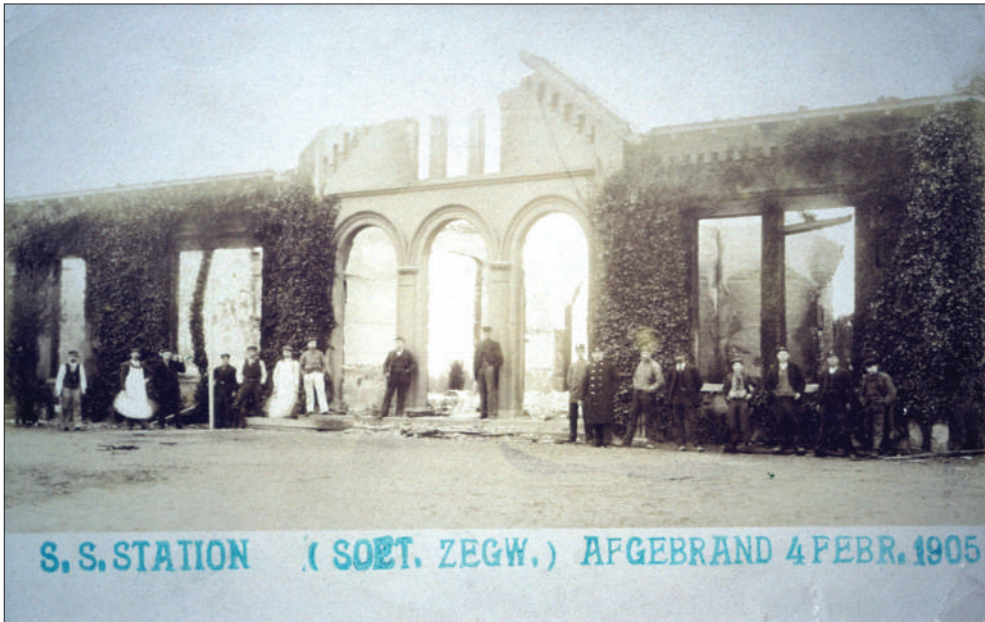
De restanten van het stationsgebouw Zoetermeer-Zegwaard na de rampzalige brand van 4 februari 1905.

aantewijzen.’ Aldus het eerste artikel. Daarna volgden artikelen over het versperren of belemmeren of verontreinigen. B&W hechtte aan goede orde, want de straf op overtreding ervan was niet mals. Een geldboete die van één tot maar liefst vijftientig gulden kon oplopen of een gevangenisstraf gedurende een tot drie dagen ‘zoo te zamen als ieder afzonderlijk’.