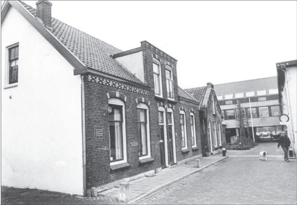
Vlamingstraat (de Laan van Brinkers). In het eerste huis woonde de familie Koole. In 1999 zijn de huizen gesloopt. Streekblad 3 september 1999