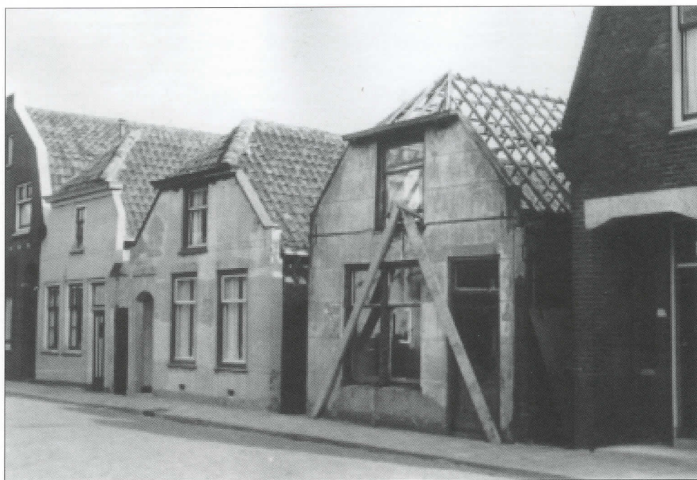
De huizen in de Dorpsstraat 162-170 in 1959. Later zou hier De Spar komen. Ze waren toen al niet meer in al te beste staat.

ellende zijn we een keer om zeven uur naar bed gegaan. Dat is maar één keer gebeurd. Wij hadden naast ons heel fijne burens en zij hadden een carbidlamp en die gaf veel licht. Maar dat ding kon echter zo ontploffen en dan was je je leven niet zeker. Vaak stond hij in een hoek van de kamer, maar dan was het licht minder. Wij gingen dus de ene avond bij de burens zitten en de andere avond zij bij ons. Mens-erger-je-niet deden we dan.