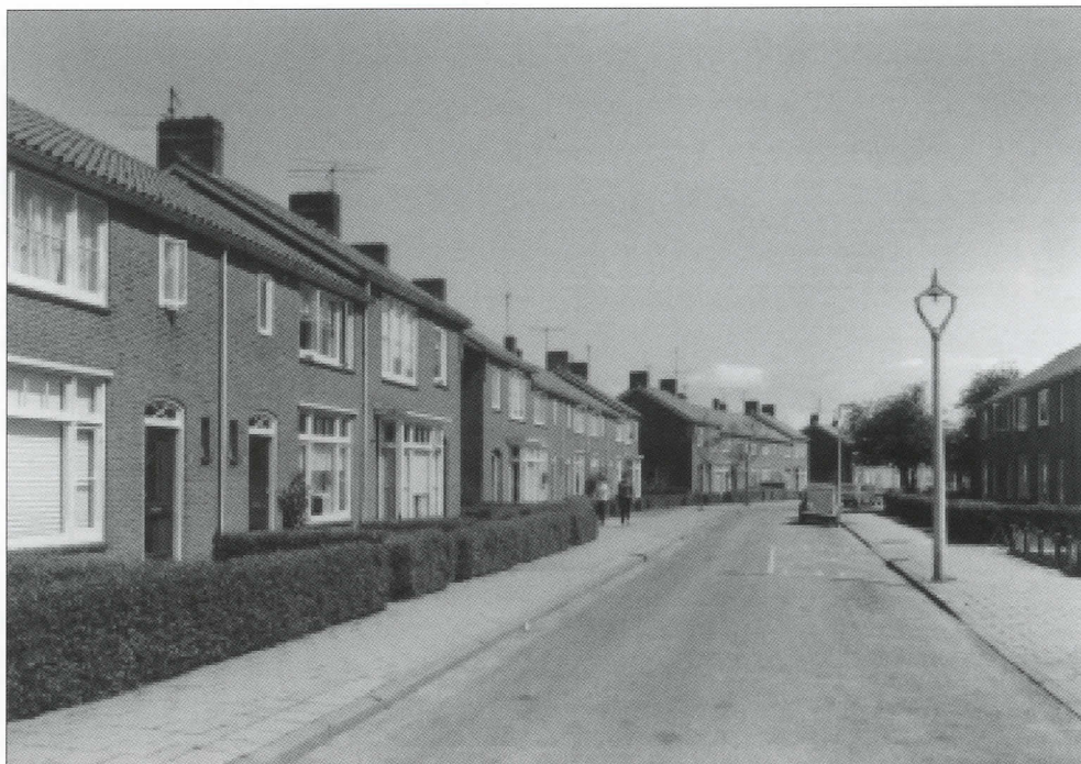
De Cornelis van Eerdenstraat was één van de eerste nieuwbouwstraten in het naoorlogse Zoetermeer.

Begin april 1945 besloten we toch maar eten van de gaarkeuken te halen. Ik had zo 'n blikje van de Betuwe, met zo'n hengsel. Ik zie mijn man nog gaan, eten halen bij de gaarkeuken. Nou dat hebben we één keer gedaan, het was niet om te eten, zo vreselijk.