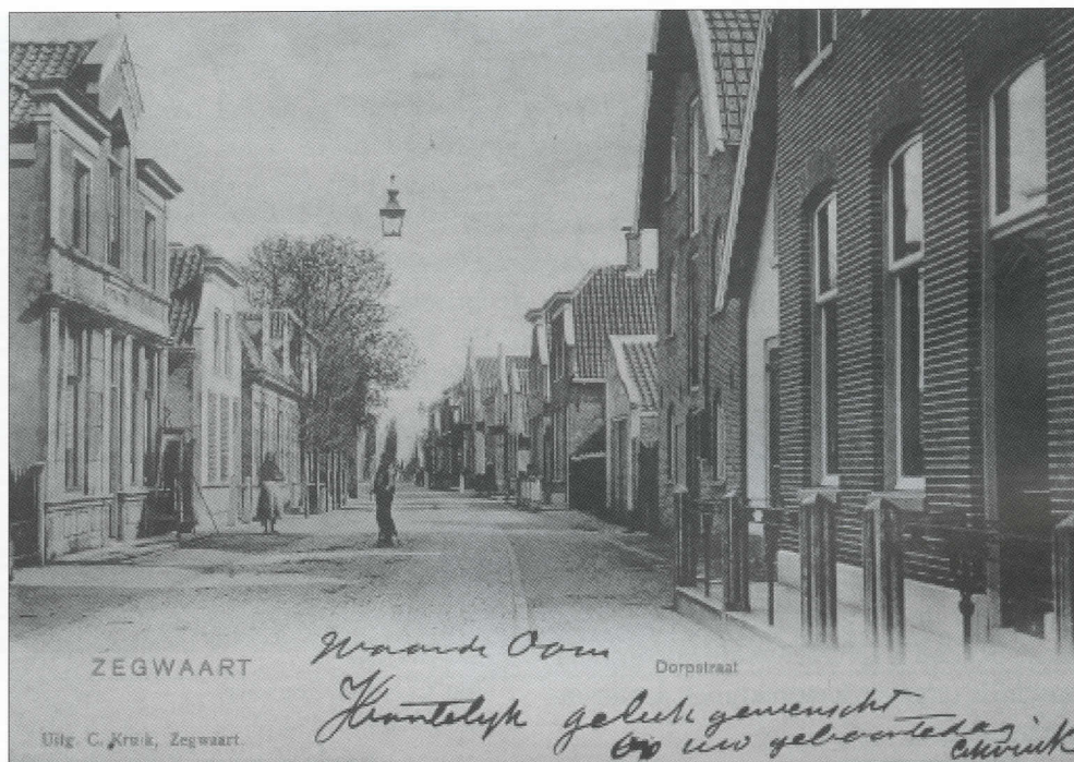
Ansichtkaart van de Dorpsstraat, uitgegeven door C. Kruik en door hem zelf verstuurd aan zijn oom omstreeks 1903.

Uitg. Wed. C. Kruik, Zegwaart. ** 10-10-1903 2)