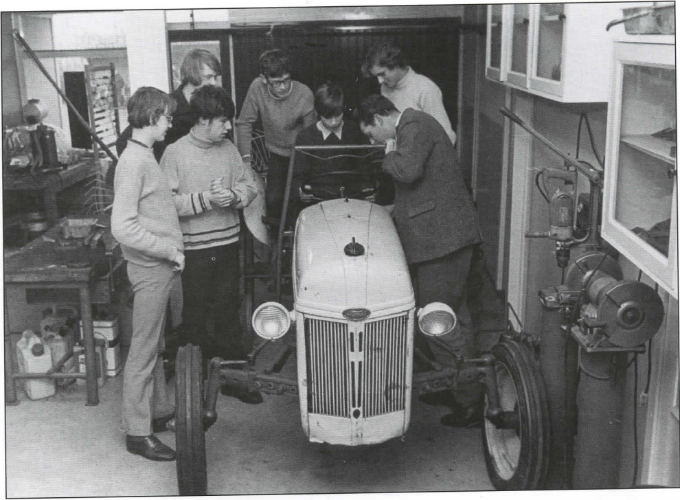
Jongens krijgen les op de landbouwtechnische school aan de Meidoornlaan in de jaren zestig

Zoetermeerse wijk op loopafstand over een plek waar kinderen een speelwerktuig kunnen vinden. Daarin is eigenlijk niets veranderd, want ook midden vijftiger jaren had de jeugd op loopafstand een echte speeltuin, want hoe ver je er ook vandaan woonde, je deed alles lopend! Iedereen vindt het ook nu nog bijzonder dat Zoetermeer toen over een speeltuin beschikte en weet ook nog precies waar deze zich bevond, namelijk aan de Schoolstraat. Als je met oud-Zoetermeesters praat over hun schooltijd, passeren vele meesters en juffen met naam en vooral bijnaam de revue. Je kende natuurlijk niet de voornaam van je meester of juf, maar je wist wel precies waar hij of zij woonde, of ze kippen of konijnen hadden en naar welke kerk ze gingen. Alle oud-meisjesschool-leerlingen maken er trots melding van dat zij nog les hebben gehad van een echt nonnetje. Deze woonden in het huis in de Dorpsstraat op nummer 33 tegenover de Nicolaaskerk, waar nu de redacties van het Streekblad en de Haagsche Courant gevestigd zijn.