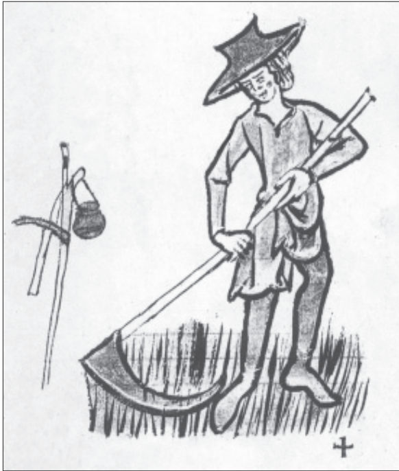
Maaier met zeis in een psalmboek uit circa 1240

herkennen, lange strook land tussen de vroegere Broekweg (nu J.L. van Rijweg en Broekwegzijde, -schouw en -kade) in het westen en de Leidsewallenwetering in het oosten. Op de oudste kaarten van het gebied rond Zoetermeer, uit het begin van de 17e eeuw, wordt het Lange Land doorsneden door een waterweg, genaamd Aemt Heyndricksvaart. Gezien het wat kronkelige verloop van deze vaart is het mogelijk dat dit een overblijfsel van een