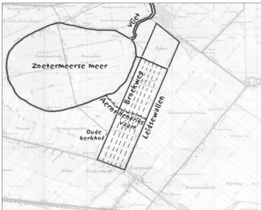
De 12-voorlinghoeven ontginning in het Lange Land geprojecteerd op een kaart uit 1950

In de omgeving van Zoetermeer is het originele verkavelingspatroon door de latere vervening en inpoldering minder goed te herkennen. We moeten hier uitgaan van de structuur van de hoofd(water-)wegen en dijken en van aanwijzingen op de vroegste kaarten van dit gebied. Zo is in archieffbronnen sprake van het 'oude kerkhof', dat gelokaliseerd moet worden aan de kruising van de Broekweg en de Zwaardslootseweg, tegenover waar nu de Sniep staat. Aangezien Zoetermeer een van de eerste ontginningen in de buurt geweest moet zijn, kunnen wij ervan uitgaan dat er geen ruimtegebrek was; wij zoeken dus een 12-voorlinghoeven ontginning met kavels van ca. 2700 meter. Met deze kennis gewapend komt er eigenlijk maar één gebied in aanmerking: het Lange Land. Dit is een, zelfs in het huidige stratenplan nog met enige moeite te