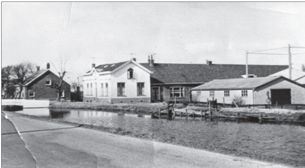
Boerderij Voorweg 112 'Het land is niet ondankbaar'