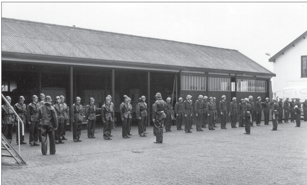
De bedrijfsbescherming (BZB) van Brinkers bij de garage aan de Vlamingstraat. vlnr: de brandweer, de redding en de EHBO