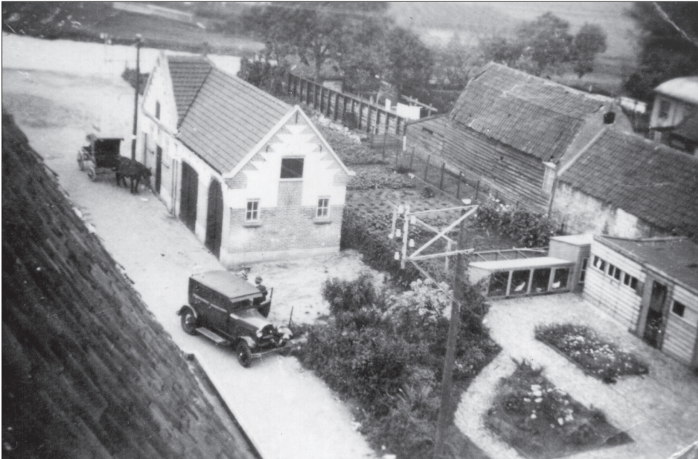
Aan de Leidsewallen was één van de drie brandspuithuisjes gelegen