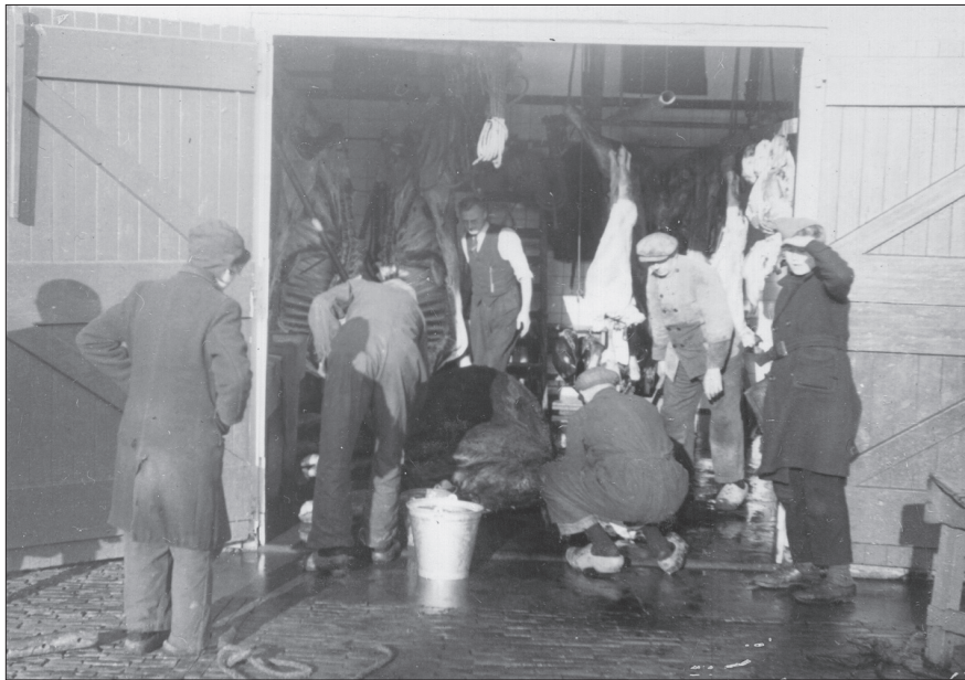
Het slachten van vee in de slachterij met enkele toeschouwers

Verder had je het slachtafval van de noodslachtingen. Daar had je weer mensen voor, die wilden de kop, de longen, het hart en de lever zal ik maar zeggen. Die mensen zijn er nog, die gewoon slachtafval willen. En je had misschien wel eens iemand die wilde een stel hersens hebben. Maar dat ging meestal zo weg. En de tong werd wel gebruikt. Er waren mensen die graag die tong wilden. Ik weet nu nog wel mensen. Als ik een tong zou hebben, zouden ze zeggen: 'Breng hem maar mee, alstublieft'. Het schijnt erg lekker te zijn als je hem goed bewerkt.