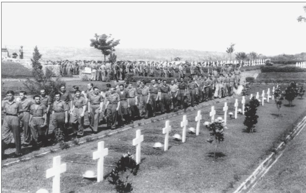
Een laatste groet aan hen die achter moesten blijven.