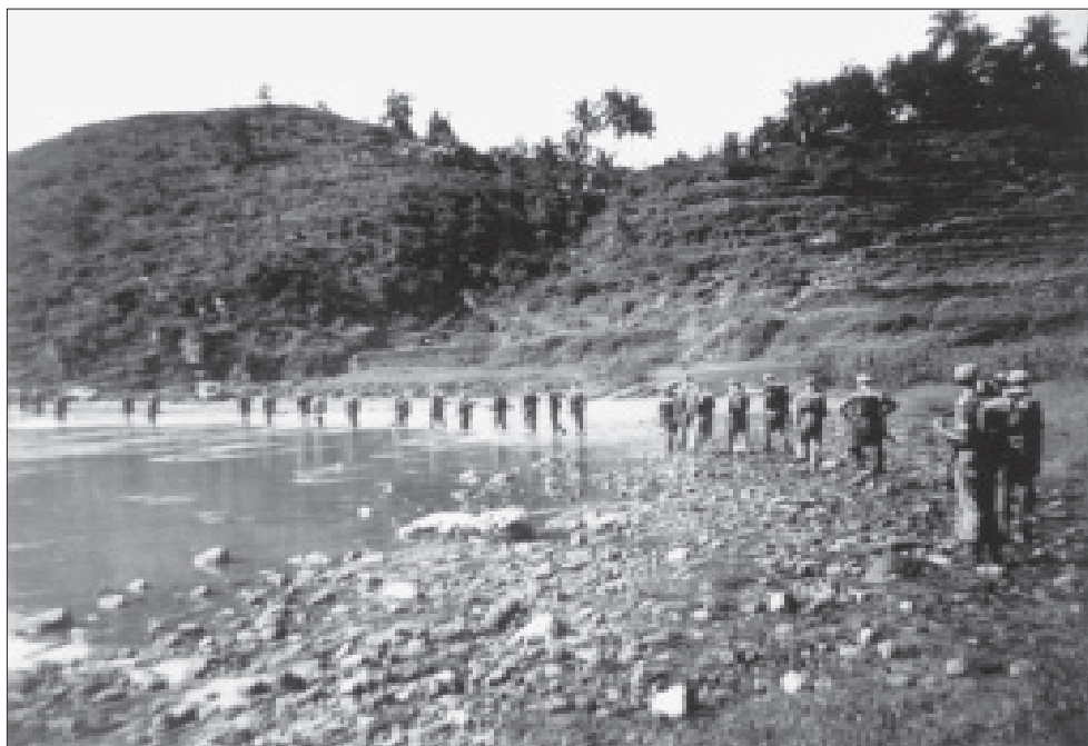
Een compagnie op patrouille.

Nederland zou een Expeditionaire Macht (EM) vormen, die uit minstens twee divisies zou bestaan. Vrijwilligers staken ter opleiding over naar Engeland: burgers die nog nooit in dienst waren geweest, beroepsofficieren die uit krijgsgevangenschap waren teruggekeerd, leden van de Binnenlandse