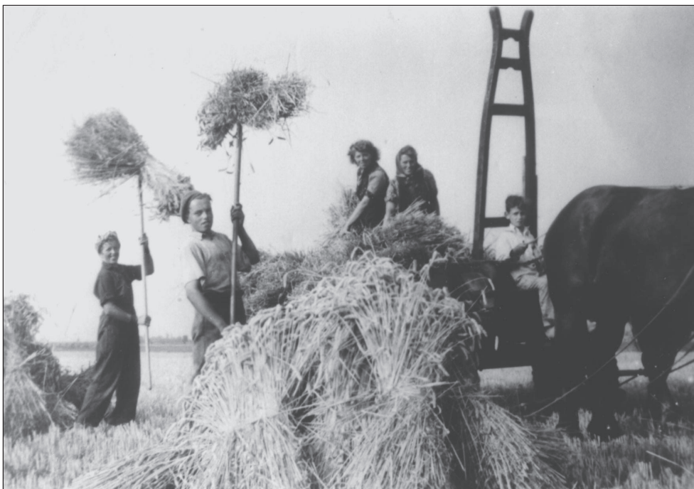
In de korenbouw konden altijd mensen worden gebruikt, met hier op de voorgrond een zogenaamd 'hok'.