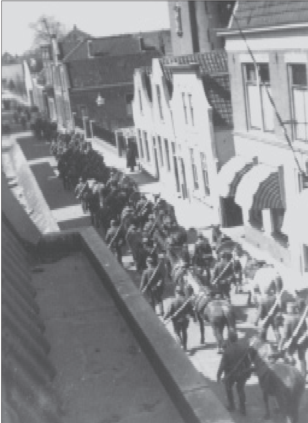
Deze foto is genomen door dhr. H.H. Hoogland in de zomer van 1940. Dit zal de eenheid veldartillerie zijn geweest die tijdelijk in Zoetermeer werd gelegerd, onder andere bij de familie Groenewegen aan de Voorweg.