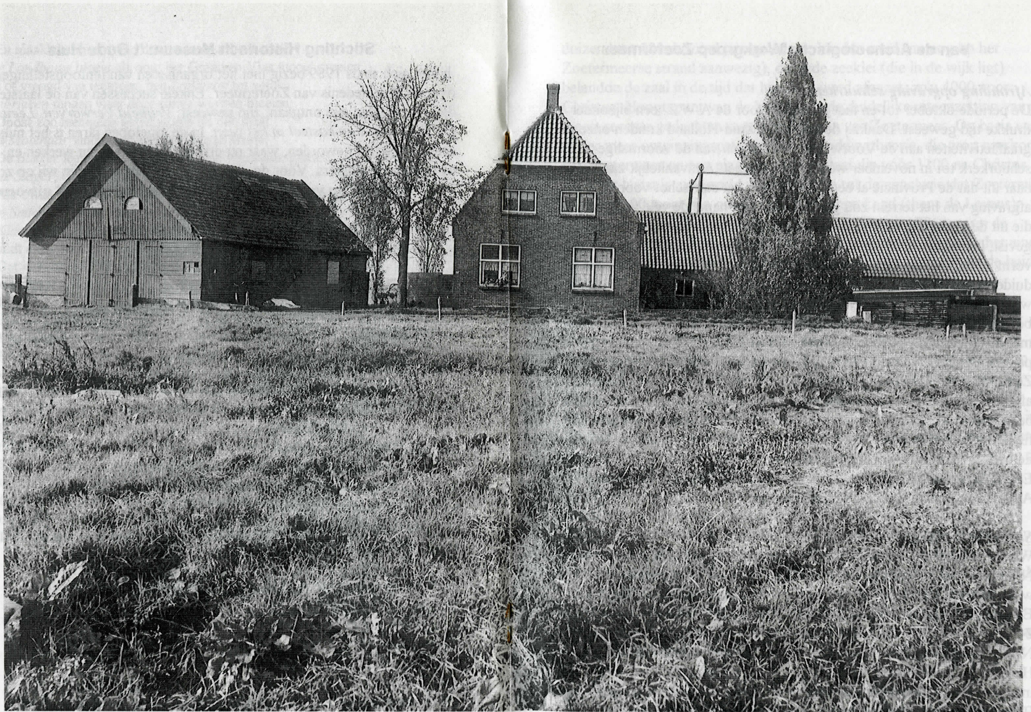
De boerderij van Kalisvaart 'aan de laan' in de Stationsstraat. Het pand maakte in 1989 plaats voor het winkelcentrum Rokkeveen. De resultaten van de opgraving, die de A.W.Z. daar vervolgens hield, worden van mei 1997 af in 't Oude Huis tentoongesteld.