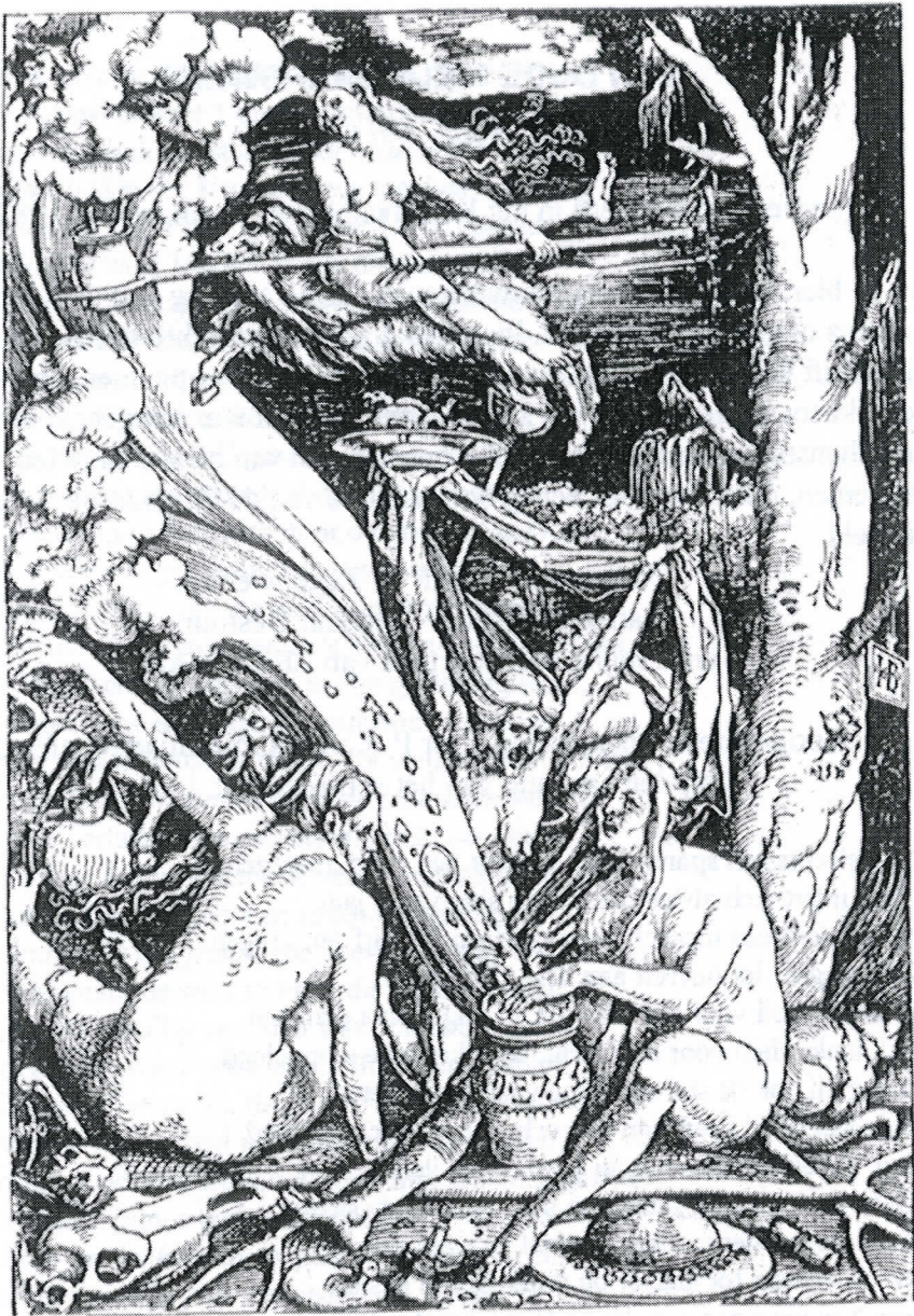
Heksensabbat , Clair-obscur houtsnede, Hans Baldung Grien, 1510