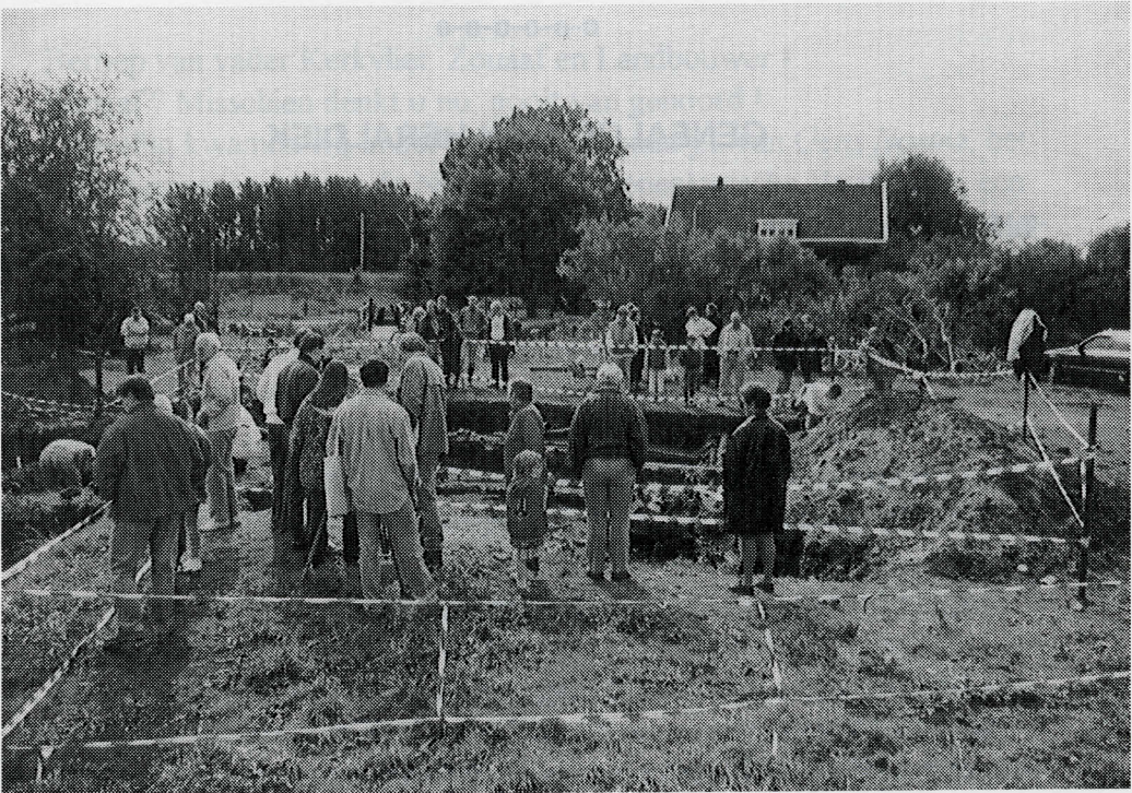
De open dag op 15 september j.l. was een groot succes. Meer dan tweehonderd mensen kwamen af op de resten van de schuurkerk.

worden, voornamelijk 'potten en pannen', geven een beeld van de materiële cultuur ten tijde van de schuurkerk. Een brede goot liep van het kerkgebouw naar de wijk; deze vormde de afvoer van het privaat. Ten westen van het kerkgebouw stond een waterput. Deze had een opbouw van steen die waarschijnlijk met een koepel was afgesloten. Het onderste gedeelte bestond uit drie op elkaar gestapelde eikehouten tonnen. De put was meer dan drie meter diep; het uit grotere diepte opwellende water was helderder dan het oppervlaktewater en beter geschikt voor consumptie. Ten oosten van het gebouw lag een uitzonderlijk grote beerput met een diameter van bijna twee en een diepte van meer dan drie meter. Helaas kwamen hieruit maar weinig vondsten om tot een nauwkeurige datering te komen. Het is onwaarschijnlijk dat de beerput en de goot tegelijkertijd in gebruik waren.