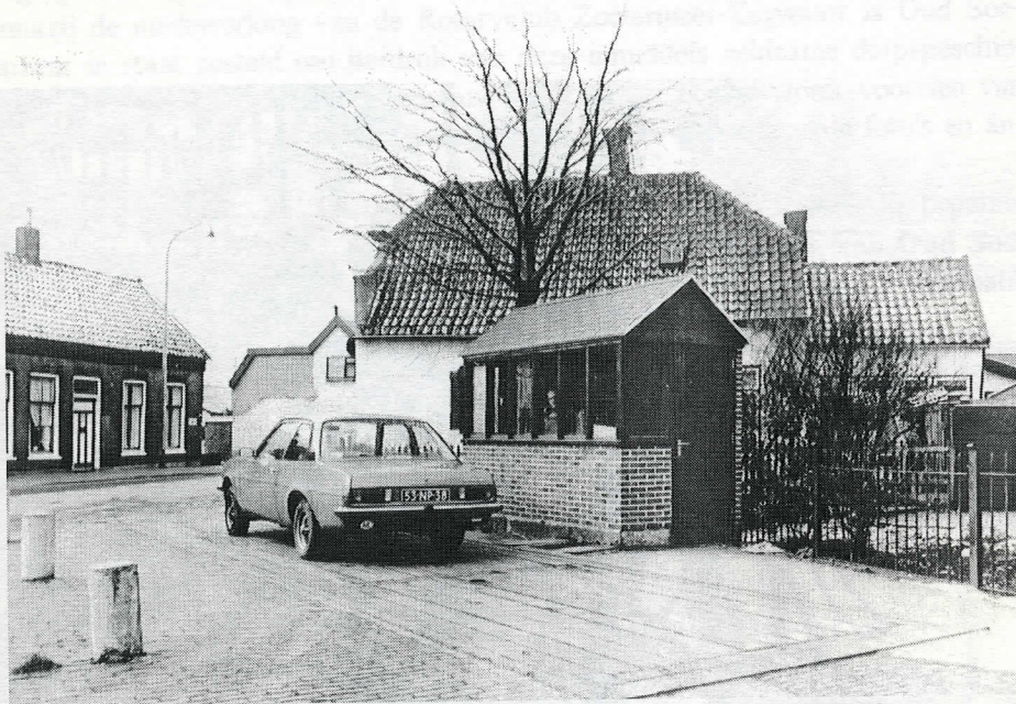
De weegbrug op de hoek van de Zegwaartseweg en Den Hoom, tot 1988 in gebruik