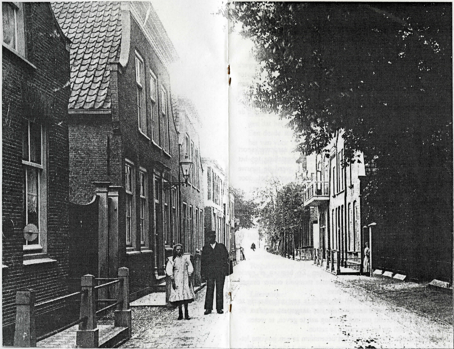
De fotograaf M.J.A. van Leeuwen maakte omstreeks 1910 deze foto van de Dorpsstraat. Links, met de lantaarn, staat het pand waarin thans Perizonius is gevestigd, daarnaast bakkerij Pieterse. Rechts, in het huis met het balkon, is onlangs restaurant D & D gevestigd. Geheel rechts, achter de boom, staat de Nicolaaskerk.