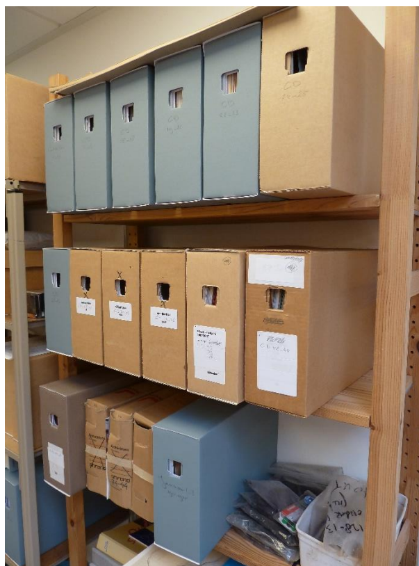
Archieven die bij Oud Soetermeer worden geïventariseerd en later omgepakt in zuurvrije omslagen en dozen

Er worden heel veel foto's en documenten (hele archieven zelfs) aan Oud Soetermeer geschonken. Na beschrijving door experts binnen de vereniging en eventuele digitalisering worden