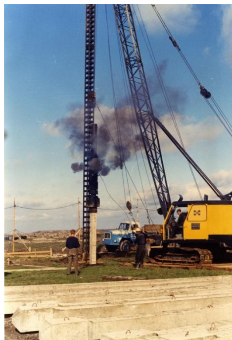
De eerste paal gaat de grond in

Het echte bouwen aan de groeistad begon in 1966 in Palenstein en de Driemanspolder. Aan de De la Gardestraat sloeg op 22 maart 1966 minister Bogaers de eerste paal de grond in voor 348 eengezinswoningen in de woningwetsector. De huren waren voor die tijd 'goed aan de prijs': fl. 154,50 per maand, inclusief stookkosten. Het zijn traditioneel gebouwde woningen met enkele prefab onderdelen. Zaterdag 10 september zal de wethouder van cultuur om 10.00 uur het bord onthullen op de hoek van de De la Gardestraat-Wolfertstraat.