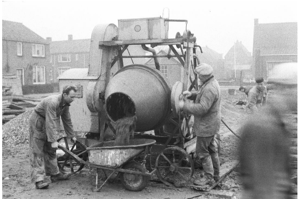
Bouw van de flat aan de John McCormickstraat in 1958 (foto G. van den Broek)

In het pand van Oud Soetermeer aan de Dorpsstraat 132 is de tentoonstelling 'Tussen dorp en groeistad 1945-1962' te zien, vanaf 10 september 2022. De expositie gaat over de enorme groei die het dorp in de naoorlogse periode meemaakte, van 6.000 naar 10.000 inwoners. Al deze nieuwe mensen kwamen te wonen in het Dorp, tussen de rijksweg en de Dorpsstraat,