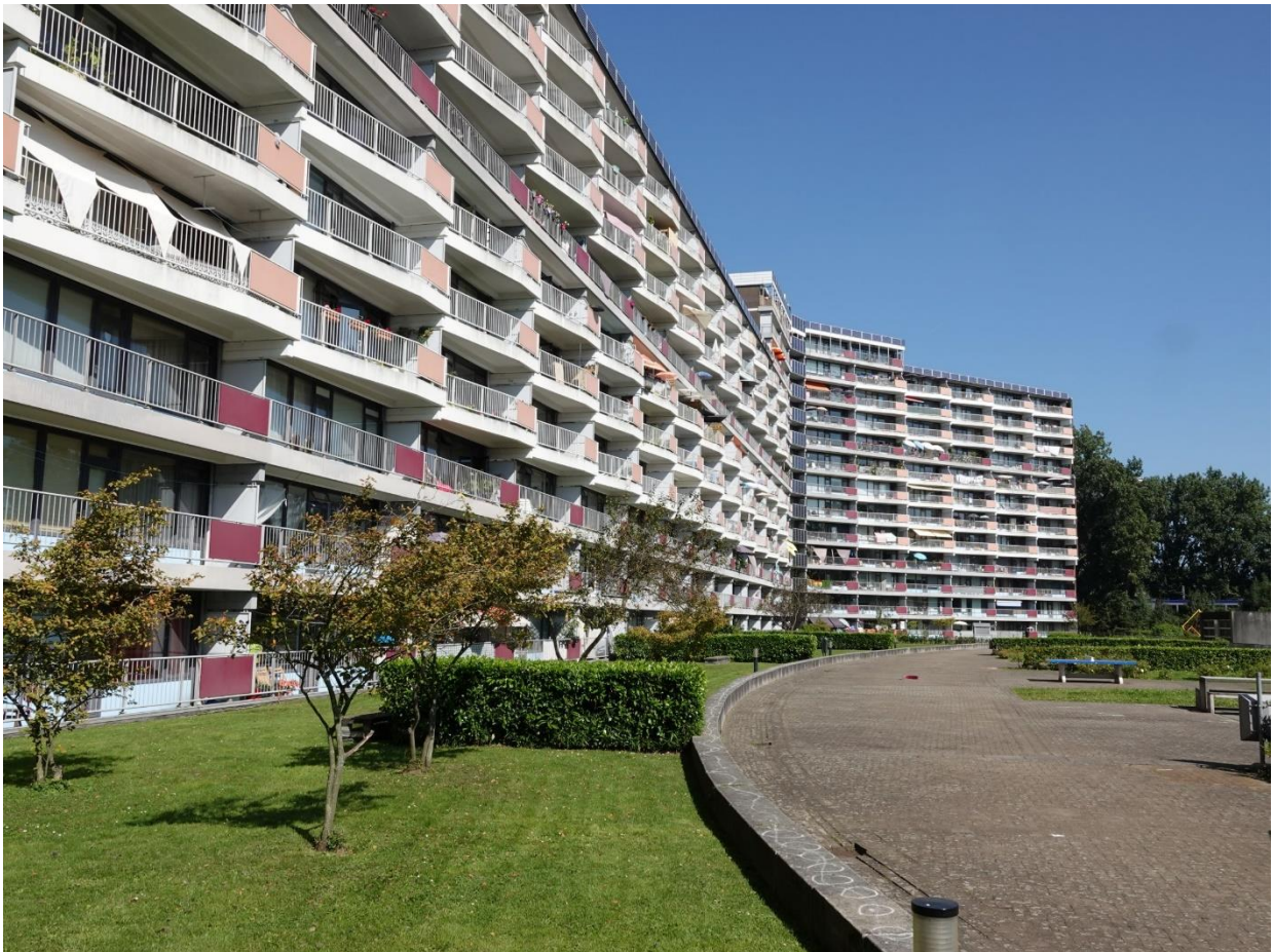
Het Savelsbos in 2021

maar dat werd 55%. De volgende wijk, Buytenwegh-De Leyens, kreeg geen hoogbouw meer, nog wel 'gestapelde bouw'. In 1965 werd Zoetermeer in de Volkskrant nog gezien als 'de modernste Nederlandse stad'.