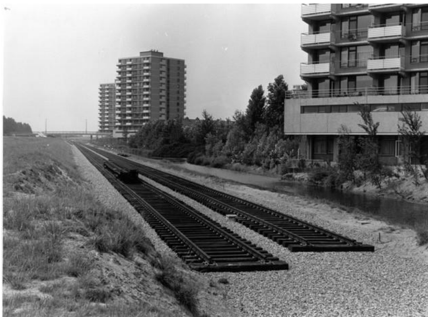
Aanleg Zoetermeerlijn tussen de stations Dorp en Delftsewallen, circa 1975

Omdat de bouw van de spoorlijn officieel in 1972 startte, wordt er door Oud Soetermeer dit jaar in het kader van 'Zoetermeer 60 jaar New Town' een tentoonstelling gewijd aan de geschiedenis van de Zoetermeerlijn. Aandacht wordt onder meer besteed aan de voorbereidingen en onderhandelingen, bouw, materieel en traject keuzes, integratie met de stad en ervaringen van NS en reizigers.