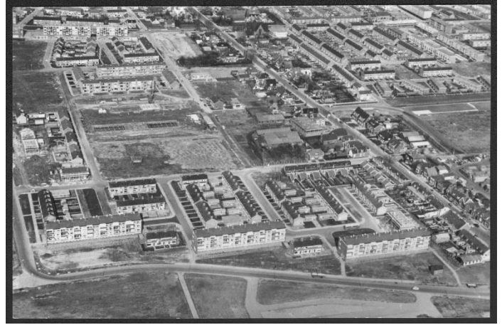
Bouwen achter de Dr. J.W. Paltelaan in 1962.

Maar hoe inclusief en gastvrij was die nieuwe omgeving in de jaren vijftig en zestig? Hoe werden de nieuwe Zoetermeesters ontvangen en hoe integreerden ze?