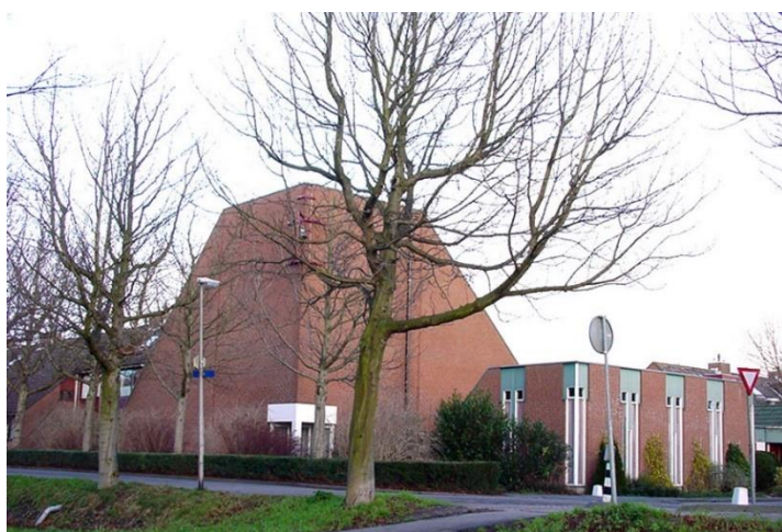
De Olijftak langs de Broekweg, nu Chinese Kerk, foto W. van As 2005

Kijk voor het volledige programma in Zoetermeer op https://www.openmonumentendag.nl/waarwil-je-naartoe/?search_type=plaats&submitbtn=Zoeken&search_value=Zoetermeer .