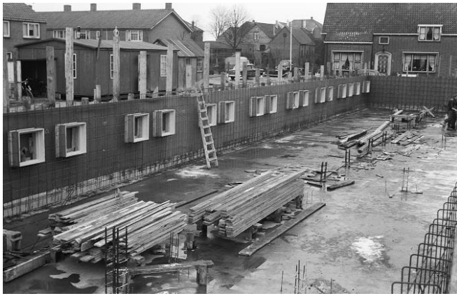
Bouw van de flat aan de McCormickstraat in 1958

is het thema “mijn monument is jouw monument”, ofwel met een modern woord: inclusiviteit. Er komt weer een boekje uit met een tocht langs de gebouwen die te bezoeken zijn.