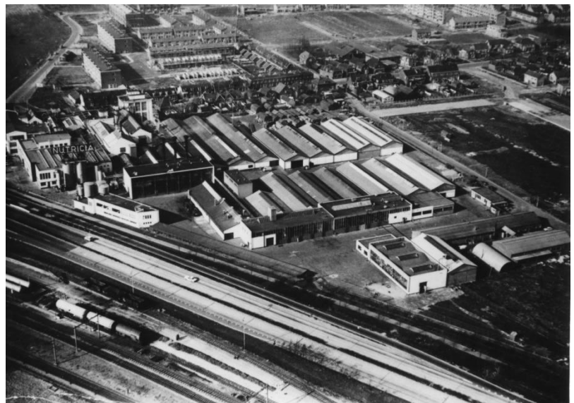
Luchtfoto van Nutricia met de nieuwbouw van het Dorp op de achtergrond rond 1960

Ook is de CHE al weer bezig met de volgende Open Monumentendag in september. Dit jaar