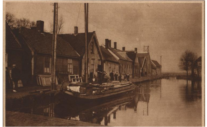
De oude haven aan de Leidsewallen

En op de valreep nog meer waternieuws: de Meervaarder vaart weer over het onbekende gebied ten noorden van Zoetermeer: www.rondvaartzoetermeer.nl