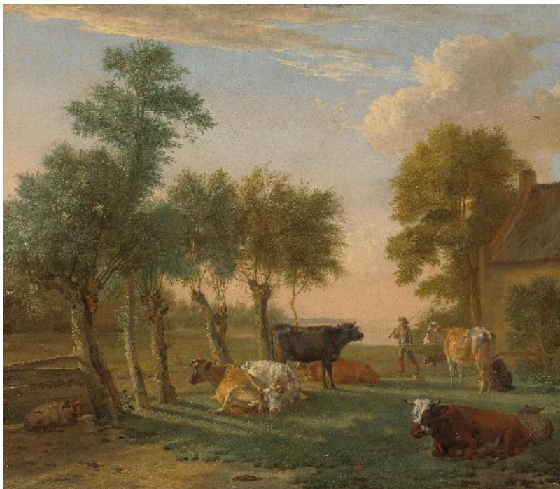
De door Paulus Potter geschilderde koeien hadden in 1653 verschillende kleuren en vormen (Collectie Rijksmuseum SK-A-711)

Het nieuwe boek over de Driemanspolder is vanaf nu verkrijgbaar. In 192 pagina's wordt een overzicht gegeven van de historie van dit enorme gebied dat zich uitstrekt van de Delftsewallen, langs Voorweg en rijksweg A12, tot en met de drie molens bij Wilsveen. Het ligt dan ook in Zoetermeer én Stompwijk.