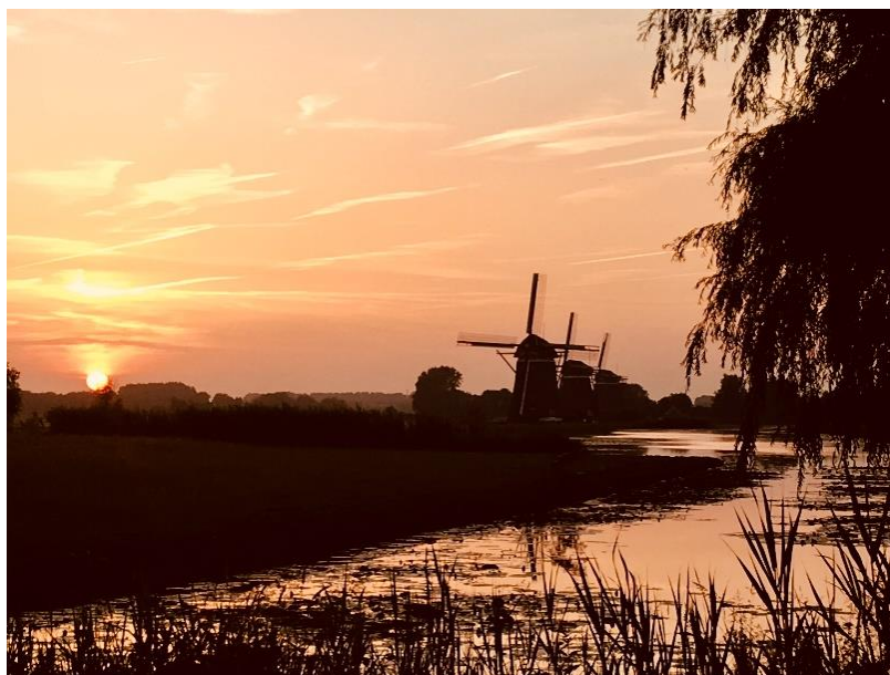
De drie molens bij Wilsveen

Leden van Oud Soetermeer betalen slechts € 18, een korting van ruim 20% !