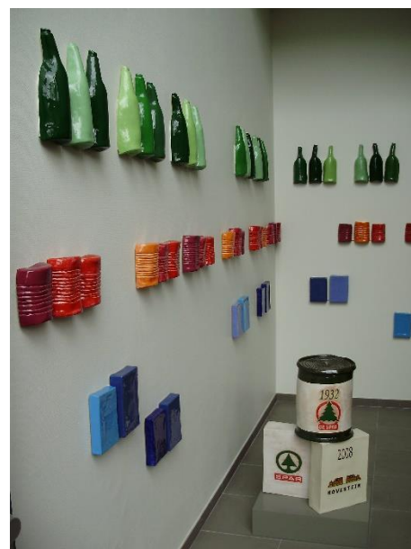
Op het einde van de Dorpsstraat (Hovestein) is een kunstwerk gemaakt als herinnering aan de oprichting van de Spar op deze plek

Net als nu was men zeer gericht op klantenbinding. De opschrijfboekjes waren voor de bestellingen die thuis werden bezorgd. Iets wat je nu digitaal doet. En de plakplaatjes of -bladen van Fiedelflier, een jongen met fluit die avonturen beleeft, lijken op de voetbal- en andere plaatjes van nu. In Benthuizen is er nu zelfs een Historisch Plakboek van Plus Verheul. Het boekje en plakboek worden toegevoegd aan het archief van de Spar in het Stadsarchief Zoetermeer, zie: https://stadsarchief.zoetermeer.nl/