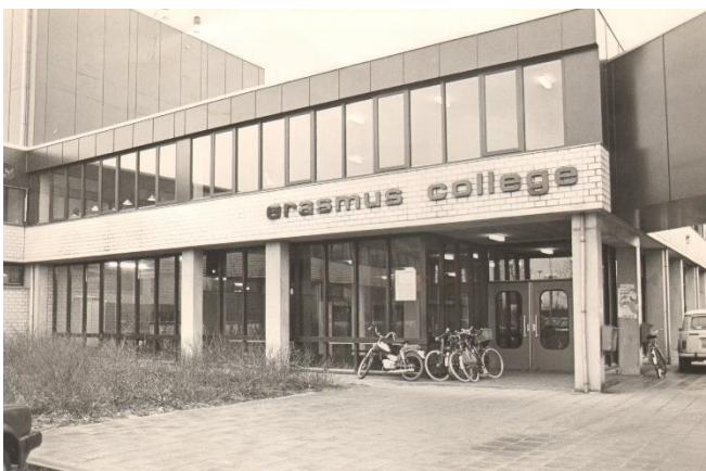
Erasmuscollege in 1985