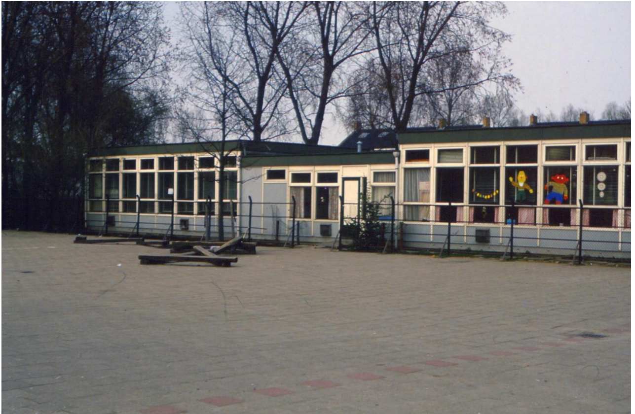
Kleutervreugd 5 Meistraat 1 begin jaren (19)80, nu het Gebarenplein van de Stichting Welzijn & Zorg Doven