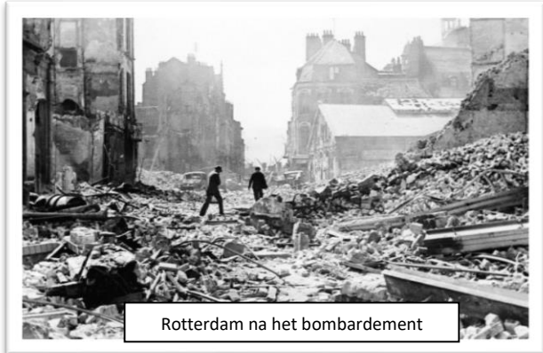
Rotterdam na het bombardement

We moeten ons bewust worden, hoe het in diverse landen nu en in het verleden bij ons zo ver gekomen is, dat mensen denken dat geweld, dood en verderf een oplossing is voor problemen. Aan ons de taak om het beter te doen en het nooit zo ver te laten komen.