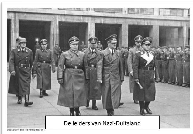
De leiders van Nazi-Duitsland

Eind jaren twintig kwam een stroming op, die we kennen onder de naam nationaal-socialisme. Hitler was een belangrijke voorman van die stroming. De Nazi's maakten onderscheid tussen rassen, godsdienst, geaardheid en waren daar erg radicaal in. Zij ontzegden Joden, zigeuners, homoseksuelen, Jehova getuigen en gehandicapten het recht op leven. Hitler wilde heersen over heel Europa en bereidde Duitsland voor op oorlog.