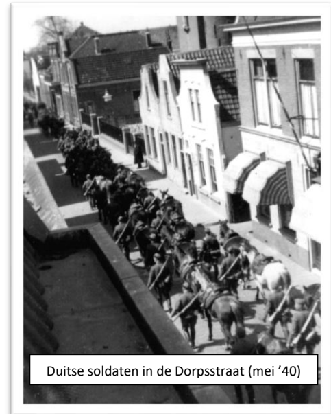
Duitse soldaten in de Dorpsstraat (mei '40)

Niet lang werd Zoetermeer met rust gelaten. In juli 1940 werd een Duitse afdeling veldartillerie in Zoetermeer gelegerd. Zij hadden veel paarden, waarvoor aan de Vlamingstraat houten stallen werden gebouwd. De militairen werden grotendeels bij burgers ingekwartierd. De Duitse militairen gedroegen zich behoorlijk en ze bouwden in het begin een redelijke verstandhouding op met de bevolking. De Landstorm en de Burgerwacht moesten hun wapens inleveren en werden opgeheven. Vanaf 1943 verliep de strijd op het slagveld voor de Duitsers steeds slechter en vanaf dat moment verslechterde de verhouding met de Duitsers. Zoetermeer werd een garnizoen achter de kustverdediging. De Duitsers vreesden voor een invasie van de geallieerden. Er werden enkele bunkers gebouwd, die onderdeel uitmaakten van de Atlantic Wall. In het Westerpark zijn de restanten in de speeltuin nu nog te zien.