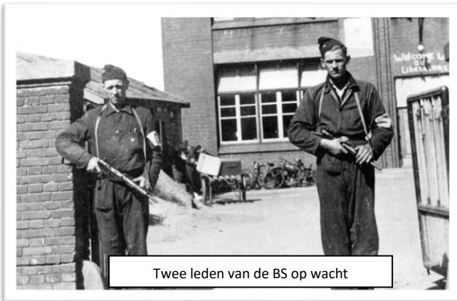
Twee leden van de BS op wacht

kwamen bij elkaar in het houten jachthuis The Jolly Duck te Zevenhuizen.