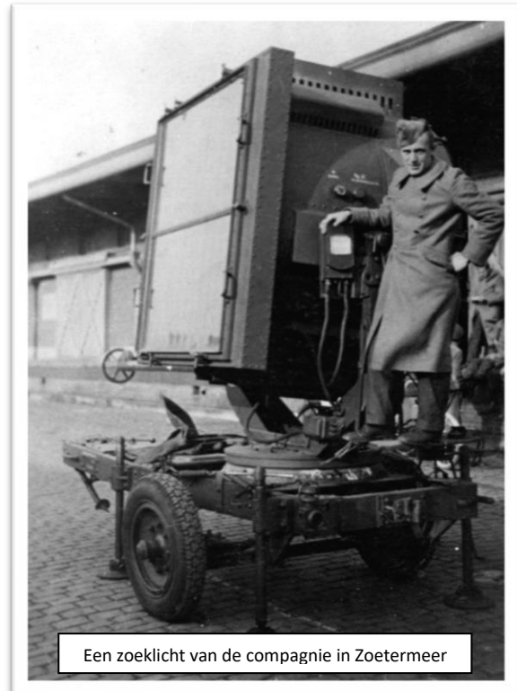
Een zoeklicht van de compagnie in Zoetermeer

Na de 1 e wereldoorlog ontstonden in heel Nederland vrijwilligerskorpsen van voormalig dienstplichtige soldaten met de bedoeling om de rust en orde te herstellen. Ook in Zoetermeer was een Landstormkorps van bijna honderd leden gelegerd. Allemaal vrijwilligers. In Zoetermeer was ook een Burgerwacht opgericht met hetzelfde doel als de Landstorm: handhaven van rust en orde. In Zoetermeer werd in oktober 1939 een detachement van de genie gelegerd. Dat was een verlichtingsafdeling met lampen waarvoor de stroom werd opgewekt door apparaten waar met de hand aan moest worden gedraaid. Tot de genie behoorden ook wagens en paarden.