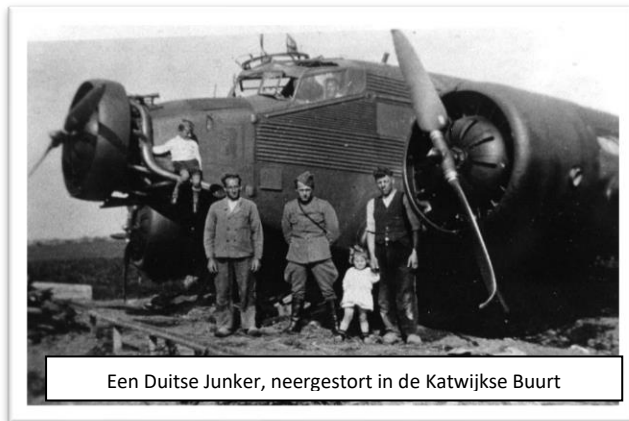
Een Duitse Junker, neergestort in de Katwijkse Buurt

Er werden enkele Duitse vliegtuigen neergeschoten. Tussen Pijnacker en Zoetermeer stortte een Duitse Junker neer. Duitse soldaten, soms gewond, zwierven in de omgeving van Zoetermeer. In de Dorpsstraat werd een noodhospitaal ingericht.