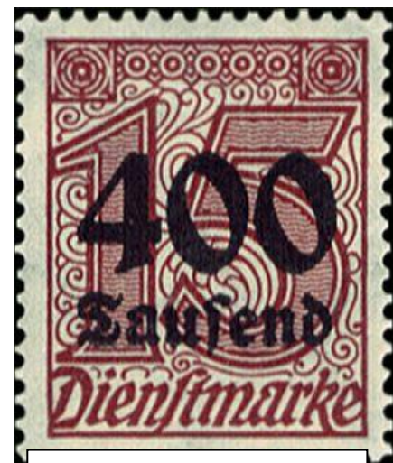
Duitse postzegel van 400.000 Mark

In Duitsland stortte de economie in. Er ontstond een hyperinflatie. Een postzegel kostte al gauw 400.000 Mark. Bij grote delen van de bevolking heerste een intense armoede.