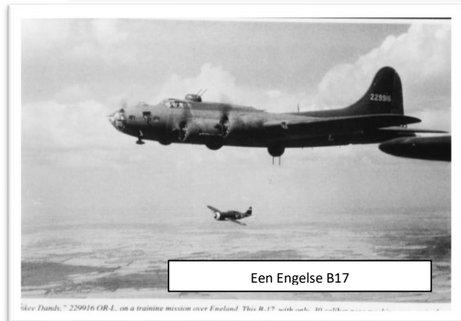
Een Engelse B17

De wacht in de toren van de Oude Kerk rapporteerde in de nacht van de 10 e mei, dat vliegtuigen overvlogen richting Ypenburg. Dat was een vliegveld dicht bij Den Haag. De wacht zag, dat parachutisten uit de vliegtuigen sprongen. Er werd ook geschoten. Het was menens.