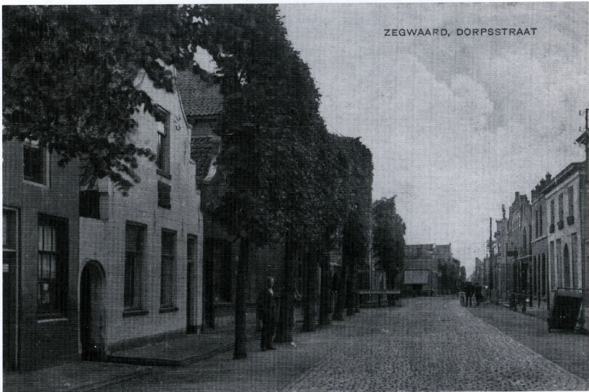
Ansicht van de Dorpsstraat in Zegwaard (vóór 1923). Door het poortje links ging je naar de lagere school aan de Dorpsstraat 70.

De verschillen in leeftijdsopbouw in de wijken van Zoetermeer zorgden in de afgelopen jaren voor schoolverhuizingen, samenvoegingen, splitsingen en zelfs alweer sloop. Namen veranderden of werden opnieuw uitgedeeld en het onderwijs veranderde met de tijd mee, niet het minst door de regelgeving vanuit 'Zoetermeer'. Eén ding bleef echter hetzelfde: net als in de middeleeuwen moeten we nog steeds leren lezen, schrijven en rekenen.