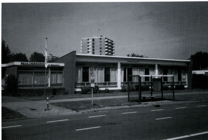
De Paulusschool aan de Dr. J.W. Paltelaan 3/3A.