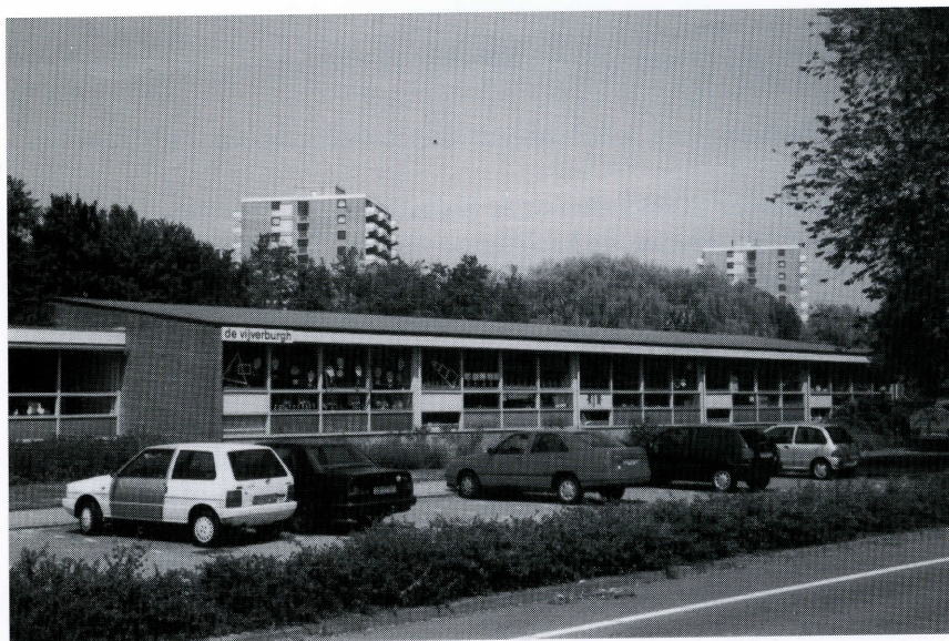
De Vijverburgh aan de Dr. J.W. Paltelaan 7.

Inwendig een centrale ruimte in de vorm van een aula. Het is bedoeld als gemeenschapsruimte. Je kunt er iets in vieren. Het begin van de week of juist het einde van de week. Een viering met bezinning, een viering met ontspanning. Je kunt er handenarbeid verrichten, het documentatiecentrum in plaatsen, overblijf organiseren en ouders op de hoogte houden van het wel en wee van de school en hun kinderen. De klaslokalen om de aula heen krijgen soms schuifwanden zodat je de lokalen bij de gemeenschapsruimte kunt trekken. Idealisme, vormgegeven in de hardware van het onderwijs. Maar de software kan het niet altijd bijbenen. De schuifwanden worden na enige tijd vervangen door vaste panelen. Het is anders zo gehorig.