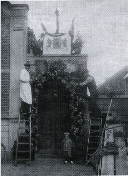
Versiering van de christelijke school bij het 50-jarig bestaan in 1911.

was een gemeenschappelijke school — , uit lesgeld en uit zijn kerkelijke inkomsten. De overheidsbijdrage bleef ruim tweehonderd jaar op hetzelfde bedrag staan. Het is dus niet verwonderlijk dat de meester in de 18e en 19e eeuw tegelijk koster, doodgraver en klokkenluider was, om zijn inkomsten een beetje op peil te houden. Ook werd hij vanwege zijn vaak fraaie handschrift wel ingeschakeld voor het schilderen van gedenkorden of, zoals in 1709, voor het penselen van de naam Zegwaard op de plaatselijke brandspuit. Vanwege het feit dat de lesgelden rechtstreeks aan de onderwijzer werden afgedragen, zorgde deze er wel voor dat zijn leerlingen naar school kwamen.