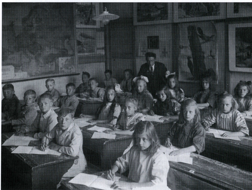
Leerlingen in de oude openbare school, 1923.

vast lange tijd ondermeester bij zijn vader geweest. Hij maakte de scheiding tussen kerk en staat mee, die hier onder invloed van de Franse revolutie in 1798 plaatsvond. Onderwijs was voortaan een overheidszaak en de Onderwijswetten volgen elkaar in snel tempo op: 1801, 1803 en tenslotte de wet van 1806 die beoogde de kinderen op te leiden tot 'christelijke en maatschappelijke deugden' via klassikaal onderwijs. Toen de schoolopziener (inspecteur) in 1838 in Zoetermeer langskwam, trof hij daar een groot en 'wel ingerigt' lokaal aan, voorzien van 18 schrijftafels en 18 kleinere tafels. Ook waren een letterbord, drie schrijfborden en een muziekbord aanwezig, alsmede negen 'leestafels van Prinsen' en een stel maten en gewichten. De opziener was over alles 'ten hoogste tevreden' en vooral over het driestemmig zingen van de kinderen. De gemeenten Zoetermeer en Zegwaart hadden de school in 1829 van de kerk overgenomen, omdat die de noodzakelijke verbouwkosten niet kon opbrengen. De armenkinderen werden als vanouds gratis onderwezen maar de gemeente Zegwaart maakte daar misbruik van door de onderwijzer te verplichten bijna alle kinderen uit die gemeente gratis te onderwijzen onder het voorwendsel dat hun ouders