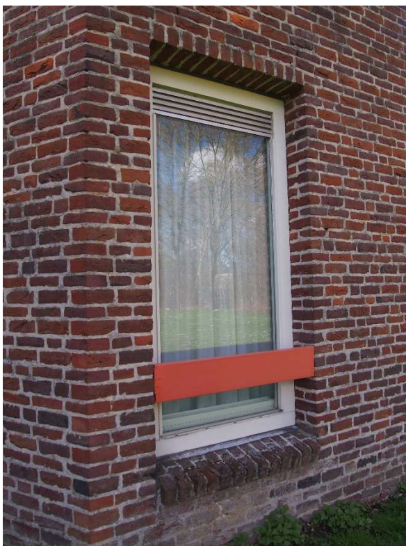
Afb.5: Venster met een gemetselde latei in de vorm van een rollaag