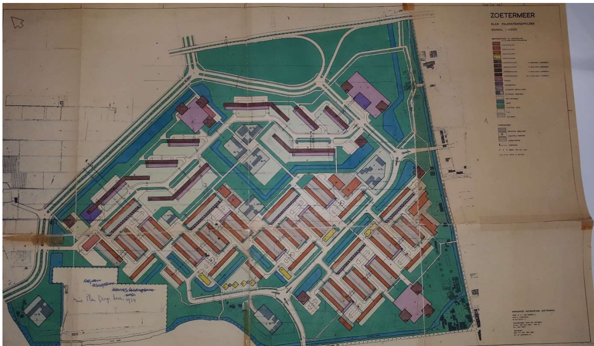
Afb. 1: Plan Palenstein uit juni 1965. Rechts de Zegwaartseweg, aan de bovenkant het geplande parkgebied (groen) en de ontsluitingswegen (Gemeentearchief Zoetermeer nr. 2760)

Tijdens het ontwerp 1 en aanleg van de wijk in de jaren zestig is geen rekening gehouden met oude structuren in de polder. Aan drie zijden langs de rand van de wijk zijn deze structuren nog wel herkenbaar 2 . Langs de noord en noordwest kant zijn twee grote rondwegen gepland en aangelegd, de Du Meelaan en de Van Aalstlaan. Via deze wegen was de hoogbouw aan deze zijde van de wijk toegankelijk. Deze hoogbouw werd ontworpen volgens de opvattingen van de jaren zestig, grootschalige repeterende rechthoekige blokken, industrieel gebouwd. De rondweg aan de dorpszijde, de Osylaan en Van Diestlaan, ontsloot de laagbouw in de wijk. Voorzieningen zoals scholen en winkels waren aan de binnenzijde van het gebied gepland waar de flats en de laagbouw samenkwamen. Bijzondere bebouwing had in de plannen de categorie Z gekregen. Hieronder viel bijvoorbeeld het in 1969-1970 gerealiseerde en in 2001 gesloopte kerkelijk centrum Het Kruispunt.