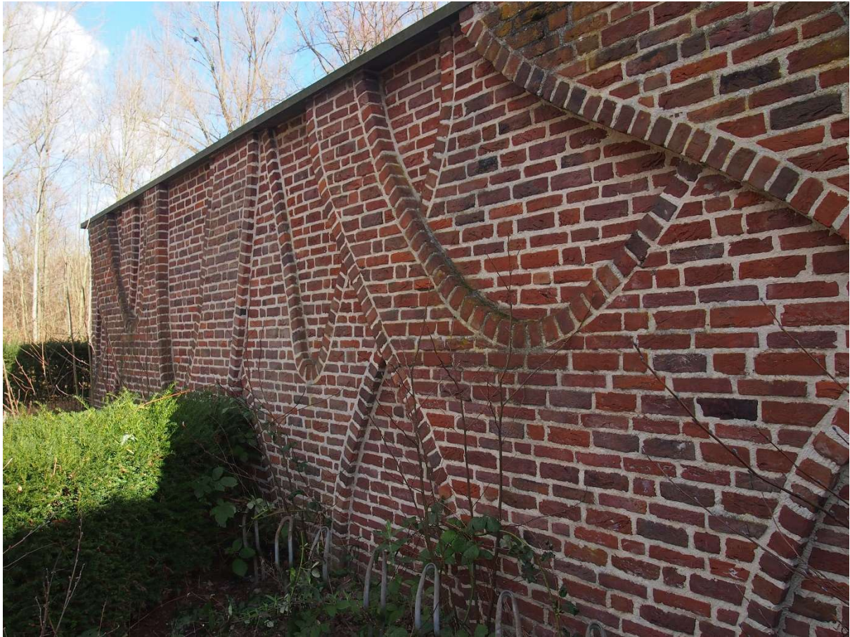
Afb.4: Muur voorzien van siermetselwerk.