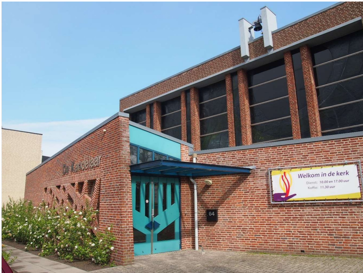
Afb.8: Kerkgebouw De Kandelaar in Amersfoort uit 1972

Het Monuta gebouw vormt door zijn kleinschalige ambachtelijke vormgeving en uitvoering een groot contrast met de grootschalige, industriële hoogbouw uit de jaren zestig ernaast 10 , waarvan een deel ondertussen is gesloopt. De bouwstijl, kleinschalig, met inspiratie uit de ambachtelijke bouw en de antroposofische bouw herinnert sterk aan de veranderde opvattingen over grootschalige bouw in de jaren zeventig.