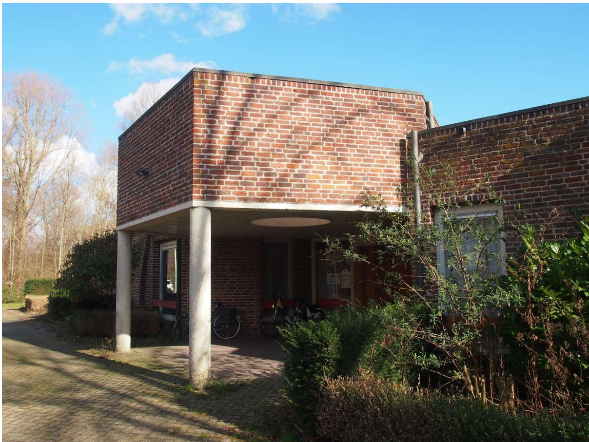
Afb.3: Ingang Monuta gebouw met links achter de muur voorzien van siermetselwerk

Het gebouw is in 1976 gerealiseerd naar een ontwerp van de architect Nic van der Stelt. Omdat het gebouw zichtbaar was vanaf de omringende hoogbouw is het ontworpen met een vijfde gevel, het dak (Afb2). Rond het gebouw werd zorgvuldige beplanting gedacht. Het veelhoekige gebouw van één bouwlaag is opgetrokken uit grote bakstenen, lijkend op de kloostermop, met een ambachtelijke uitstraling (Afb.3,4). Er is gebruik gemaakt van een wild metselverband, het wildverband, met subtiele details in de gevels. Herkenbaar zijn details zoals de rollaag (op hun kant gemetselde stenen) onder de dakrand en de rollaag boven de vensters (Afb.5). De glasstroken langs de verhoogde dakvlakken voorzien het interieur van daglicht. De aula heeft een decoratieve glasgevel (Afb.6). Het interieur is sober en afgewerkt met een houten plafond.