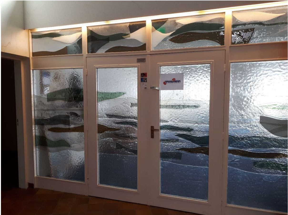
Afb.6: Interieur met de glazen wand van de aula. De glasstrook langs het verhoogde dak voorziet de ruimte van daglicht

Het gebouw vertelt een stukje sociaal-culturele geschiedenis. Typisch voor de jaren zeventig was de aanwezigheid van het zogenaamde koel- en sectievertrek in het gebouw. Zoetermeer had destijds geen ziekenhuis en het grote politiebureau zou pas in 1981 gerealiseerd worden. In het koel- en sectievertrek kon sectie worden verricht op slachtoffers van dodelijke ongevallen. Het rouwcentrum werd in Zoetermeer Stad genoemd als behorende tot de best-geoutilleerde rouwcentra in Nederland. 5