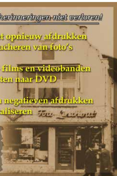
FOTO LINTHOUT al 63 jaar dé vakfotograaf! Dorpsstraat 68 www.fotolinhout.nl Zoetermeer info@fotolinhout.nl (079) 316 3084