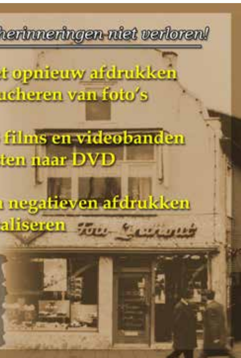
FOTO LINTHOUT al 63 jaar dé vakfotograaf! Dorpsstraat 68 www.fotolinhout.nl Zoetermeer info@fotolinhout.nl (079) 316 3084