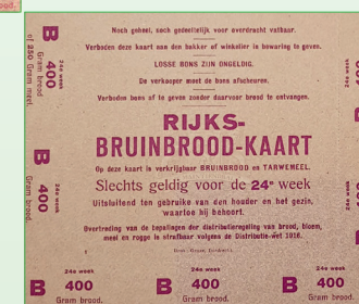
Rijks-Broodkaarten 1916-1919

Ook in Zegwaart werd in juli 1915 door de gemeenteraad een verordening aangenomen waarin het gewicht van het brood werd bepaald en het toezicht daarop werd geregeld. Het brood moest een gewicht hebben van een halve kilo of een veelvoud daarvan, met een toegestane afwijking van slechts 5%. Het brood moest met een cijfer gemerkt worden dat het gewicht van het brood aangaf. De verordening gold niet voor 'kadetjes, ander klein brood, luxe brood en krentenbrood'. Het brood moest 'goed gaar gebakken (zijn) en samengesteld (zijn) uit zuivere en gezonde bestanddelen zonder toevoeging van enig schadelijk preparaat'. Op overtreding van de verordening stond een geldboete van ten hoogste f 25,- of maximaal zes dagen hechtenis. Ondanks de regulering verergerde de situatie en daarom besloot minister Posthuma in 1916 om het 'ongebuilt bruinbrood' door ander bruinbrood te vervangen, het zogenaamde 'regeringsbrood'. Dit was een stevig, donker brood, gemaakt van meel van rogge,