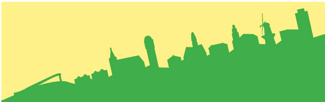
Dorpsstraat 132 2712AN, info@oudsoetermeer.nl, www.oudsoetermeer.nl . Geopend maandagavond en woensdag- en zaterdagmiddag. Helaas nog wel met enkele beperkingen.

We komen weer bij elkaar. Woensdag 13 oktober vindt de Algemene Ledenvergadering plaats in 't Centrum. Het verslag van de eerdere 'digitale' vergadering staat in 't Seghen Waert 2021-2 (pag. 40) en de agenda voor de komende en de wijze van aanmelden staat in het volgende 't Seghen Waert, dat u over een week of twee op de deurmat vindt.